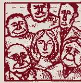
Quants més serem, més ferem fins la pesseta alçarem!!!

econòmics del funcionament de la pesca de la balena, de la qual ens dóna atenta notícia Ismael, narrador de la novel·la Moby Dick , on es detalla el repartiment dels beneficis del negoci entre els participants en funció de la seva qualificació, des de l'arponer —qui sap si caníbal— fins al capità Ahab, que no sembla especialment mogut per interessos financers.