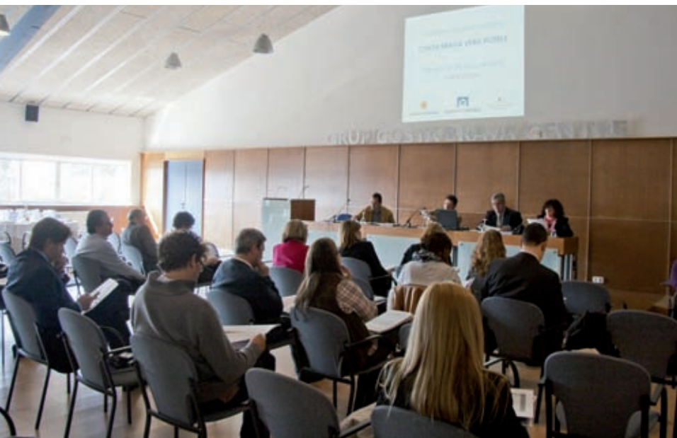
COSTA BRAVA VERD HOTELS

també al fet que l'organització ha deixat en molts casos de fer d'intermediari, ja que cada vegada són més els establiments que fan directament ells la venda electrònica.