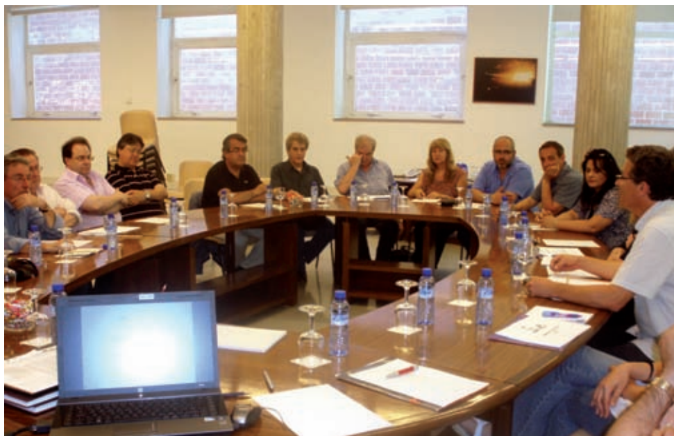
MÚSICS DE GIRONA

>> Socis de Músics de Girona durant una assemblea.