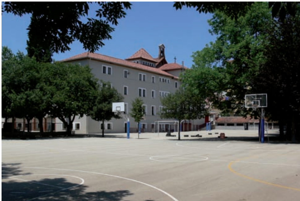
>> Pista de bàsquet de l'escola el Petit Plançó.

Benjamin Franklin afirmava: «Digues-m'ho i ho oblidaré, ensenya-m'ho i ho recordaré, involucra-m'hi i ho aprendré». La frase del científic és precisament la màxima de l'escola. «Tot i que la idea va dirigida a uns