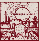
Però amb molts anys i paciència s'eixampla la convivència.