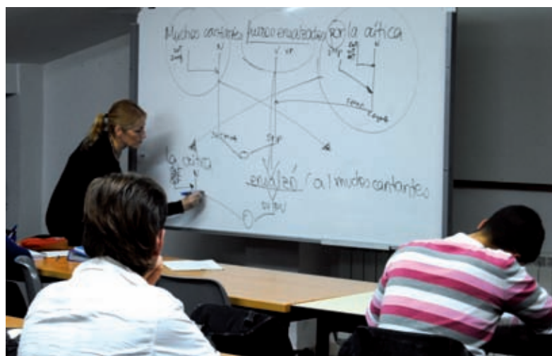
>> Imatges dels diferents serveis que ofereix la cooperativa Suara.

La finalitat fonamental de Suara va ser oferir una atenció propera a través d'una gestió democràtica. Actualment es tracta de l'empresa de serveis d'atenció a les persones més gran que hi ha a Catalunya, amb una experiència acumulada de més de trenta anys pels seus socis fundadors. Desenvolupa la seva activitat en els sectors educatiu, de serveis socials, sanitari, laboral i formatiu. Ofereix serveis a la infància, als joves i a les famílies, a les persones amb risc d'exclusió social, a les persones amb necessitats específiques laborals o formatives, a la gent gran i a les persones amb discapacitat. Els seus clients són, majoritàriament, les administracions públiques: municipals, comarcals, diferents departaments de la Generalitat de Catalunya i altres administracions estatals i europees.