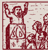
Tot ho mena una doctrina i escampar-la és feina fina.