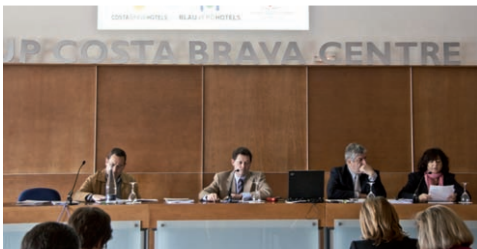
COSTA BRAVA VERD HOTELS

La cooperativa va tancar l'exercici del 2011 amb una caiguda del 16 per cent de les vendes respecte a l'any anterior, principalment a causa de la davallada de la demanda però