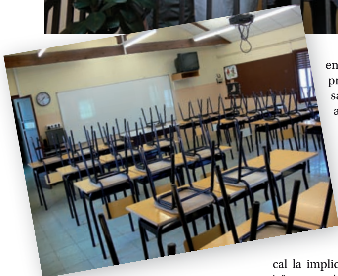
>> A dalt: tutors dels alumnes d'ESO de l'escola El Petit Plançó; a baix: una aula del centre.

entendre's amb uns proveïdors per tal de satisfer la demanda», afegeix.