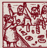
Roneix la cooperació. Endavant i autogestió!