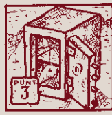
Són dels socis tots els guanys, mai s'atresoren amb panys.