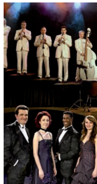
MÚSICS DE GIRONA