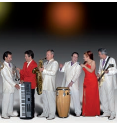
MÚSICS DE GIRONA