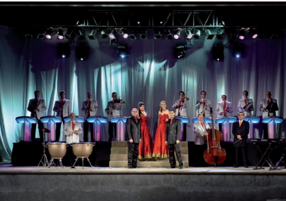
MÚSICS DE GIRONA

>> Orquestra Montgrins (a dalt) i Maravella (a baix).