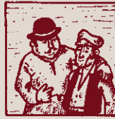
Norma legal i ordinària: la idea es fa expansionària.