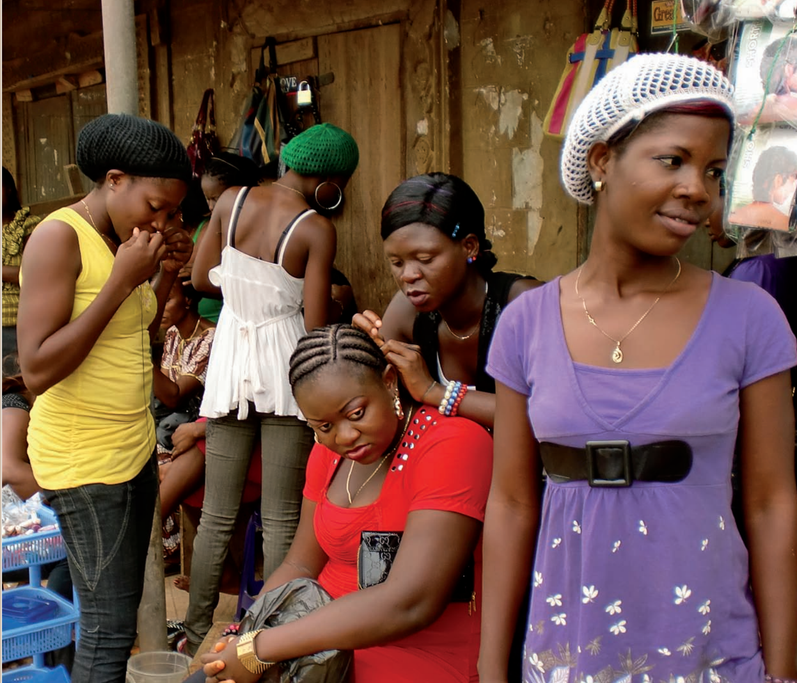
>> La majoria de les noies d'origen nigerià que es dediquen a la prostitució a Europa provenen de la ciutat de Benin City, la capital de l'estat d'Edo.