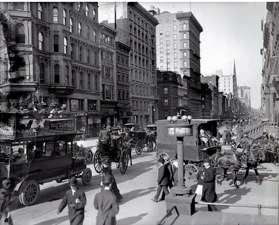
>> La Cinquena Avinguda de Nova York, l'any 1910.