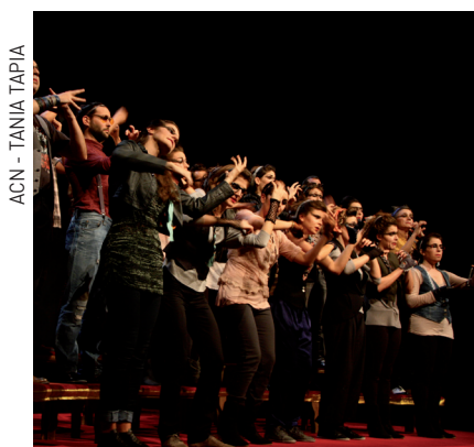
>> Els banyolins Cor de Teatre.