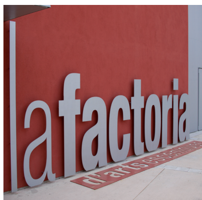
>> L'equipament cultural La Factoria d'Arts Escèniques.