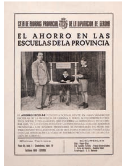
>> Cartell de foment de l'estalvi.

la integració, els respectius consells d'administració de les entitats asseguren que la nova entitat serà més sòlida i més dimensionada, la qual cosa permetrà un major accés als mercats internacionals de capital. La reestructuració implicarà també una important reducció de plantilla (més de 600 persones entre les quatre entitats) i de la xarxa d'oficines.