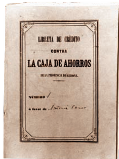
CARLES MIRAL - FONTS DIPUTACIÓ DE GIRONA - INSPA

La primera oficina de Caixa Girona fora de la demarcació es va obrir a Barcelona el 1989