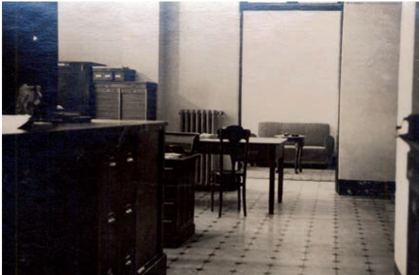
>> Interior d'una antiga oficina.