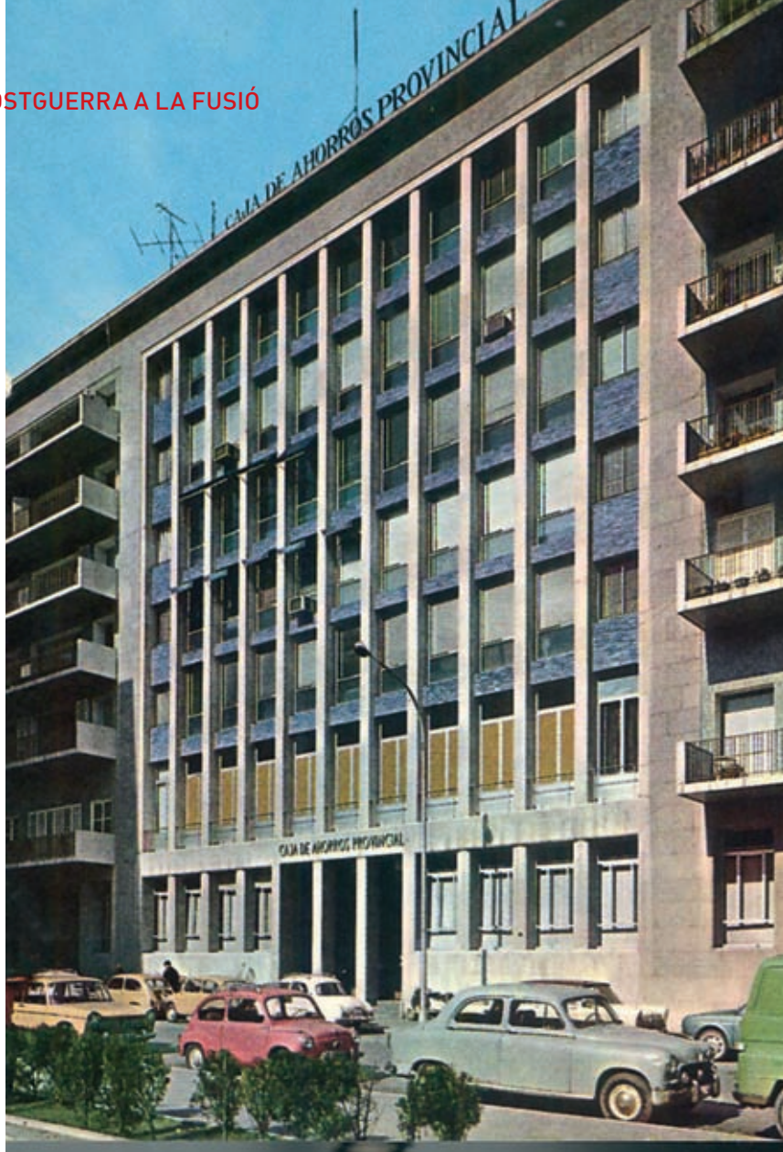
>> L'antiga seu, a l'avinguda Sant Francesc de Girona, els anys 70.

La majoria d'aquestes entitats, que disposaven de pocs clients i movien un volum de dipòsits escàs, van acabar absorbides per la Caixa de Pensions.