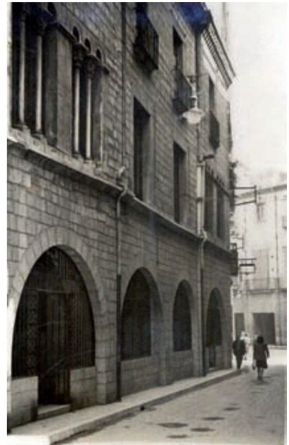
>> La Fontana d'Or, seu de Caixa Girona el 1940.

Amb els anys, la millora de la situació econòmica i l'increment de les mesures de seguretat a les sucursals financeres, els atracaments han disminuït, fins a convertir-se en accions molt aïllades. No obstant això, les entitats financeres continuen en el punt de mira dels delinqüents, i Caixa Girona no n'és una excepció. El gener de 2008, els Mossos d'Esquadra van detenir dotze persones, entre les quals hi havia el director d'una oficina bancària de Caixa de Girona a Malgrat de Mar, acusades d'estafar gairebé 5 milions d'euros a aquesta entitat bancària a través d'operacions fraudulentas de préstecs amb garantia hipotecària. Per fer les estafes, els detinguts compraven una finca al seu propietari legítim a preu de mercat mitjançant una hipoteca sol·licitada a la sucursal de Malgrat de Mar. Immediatament, el comprador venia l'immoble a un preu molt superior a un altre membre de la mateixa organització, el qual demanava una nova hipoteca en la mateixa oficina, que li concedien amb l'ajuda del director de la sucursal i amb la qual cancel·lava la del primer comprador.