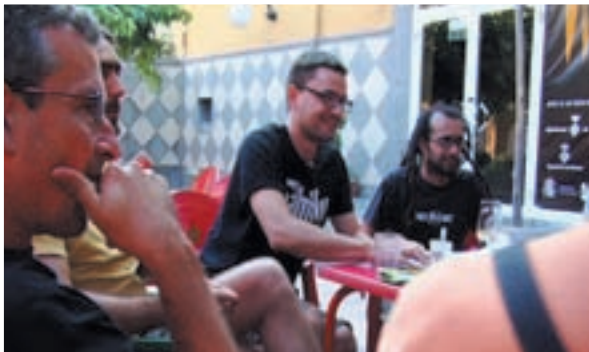
>> El Curt.doc va reunir enguany els responsables dels festivals gironins.

Curiositats de la vida, Curt.doc va néixer d'una manera semblant; una conversa informal sobre cinema en una cèntrica taverna basca de Girona entre tres amics va acabar amb una proposta sobre la taula: crear un festival de curtmetratge documental. De fet no en coneixíem cap al país, i això ens podia donar certa singularitat. La tercera cervesa va ser la definitiva per embrancar-nos-hi; ho vàiem clar i no podia fallar. Després d'això, la frase «Per què vam demanar la tercera?» surt sempre en moments de dificultat o de molta feina, no com a retret però sí com a constatació que en aquell moment no vàiem res difícil, teníem una idea clara i la volíem dur a terme. Ara tenim les idees més clares però les dificultats s'han multiplicat de manera proporcional a les alegries que el festival ens ha donat.