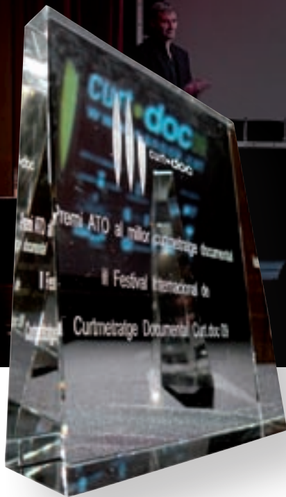
>> Entrega de premis del darrer festival Curt.doc a Vidreres.