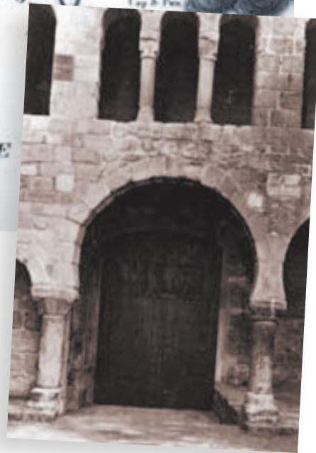
>> Detall de la Porta Ferrada, símbol del monestir benedictí.

El poble de Sant Feliu es trobava dividit en dos bàndols: els partidaris dels religiosos i els partidaris dels liberals