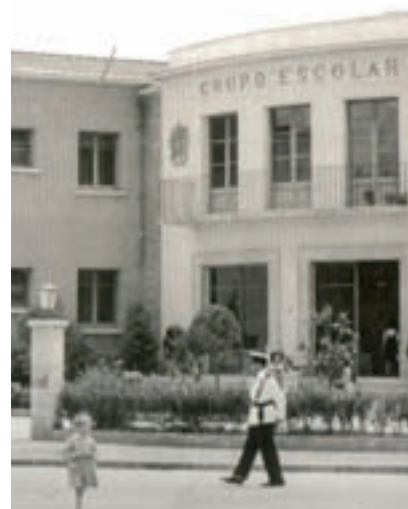
JOSEP M. MATEU / ARXIU ARREBOLA-ARPA.