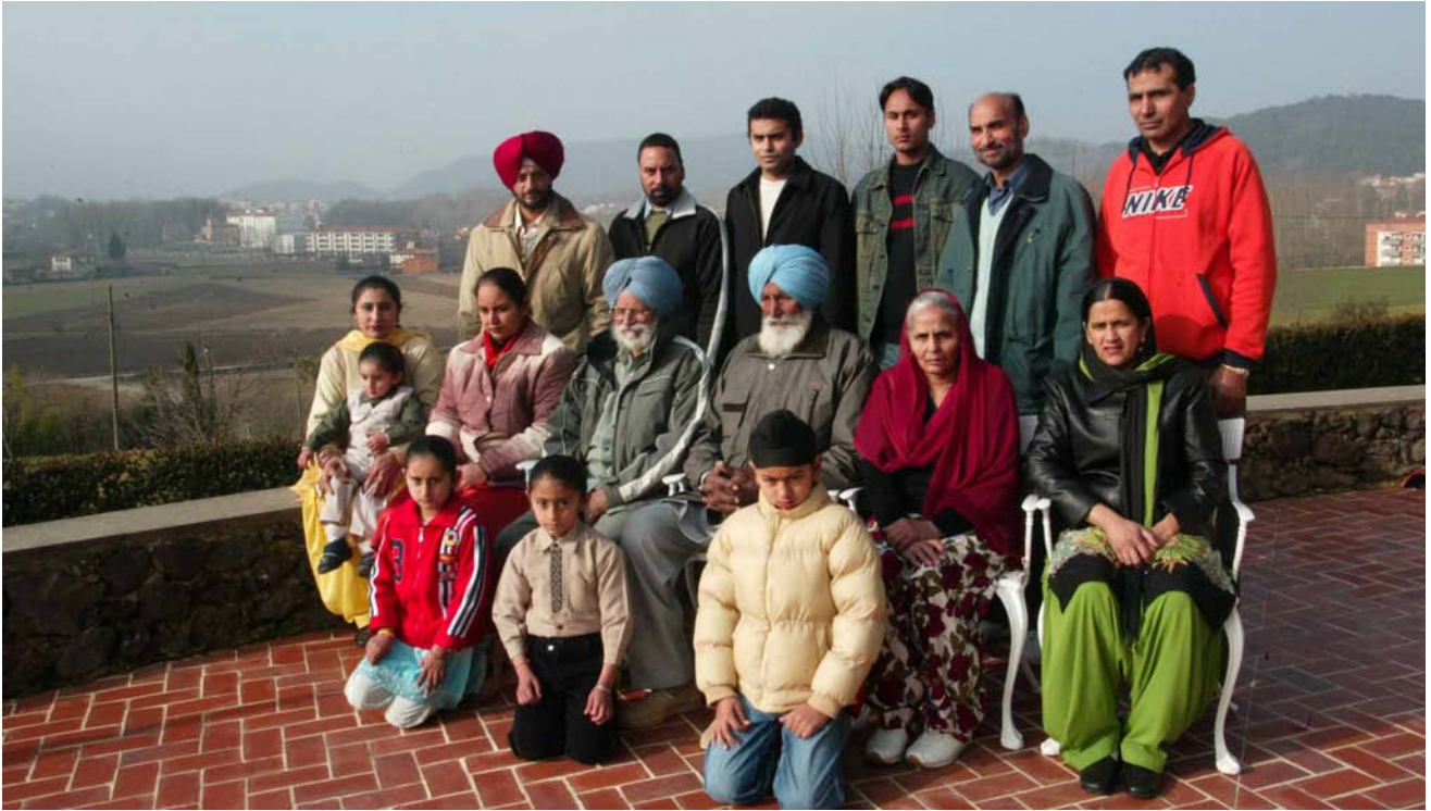
>> Panjabis de la Garrotxa, reunits a Olot.

usava els cartells, els anuncis, els adhesius i l'ocupació de l'espai públic per difondre missatges a favor de models socials alternatius. Entre les preocupacions de Staeck hi havia el racisme, l'antimilitarisme, el capitalisme o el feixisme. Així doncs, el meu client va decidir publicar un anunci oferint una recompensa a qualsevol que demostrés l'existència d'un tracte de favor als immigrants, pel sol fet de ser immigrants, davant de la resta de població.