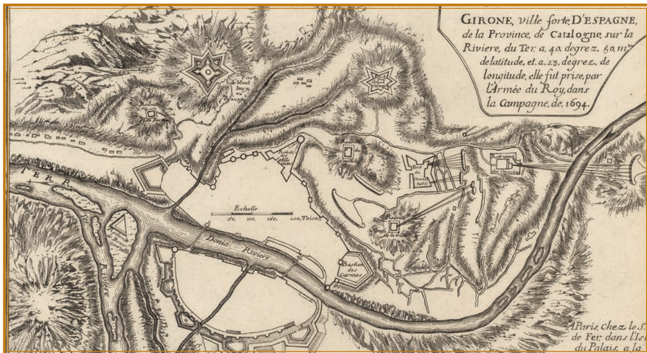
>> Gironne, ville forte d'Espagne. Mapa de Girona del 1694.

de la població, i es va recórrer al consum de carn de cavall, d'ase, de gos, de gat i de ratolí, carn que es pagava a preu d'or. En els monestirs ja només es consumia pa i aigua, i molts religiosos començaren a fugir de la ciutat, mentre els jesuïtes socorrien els malalts i afligits.