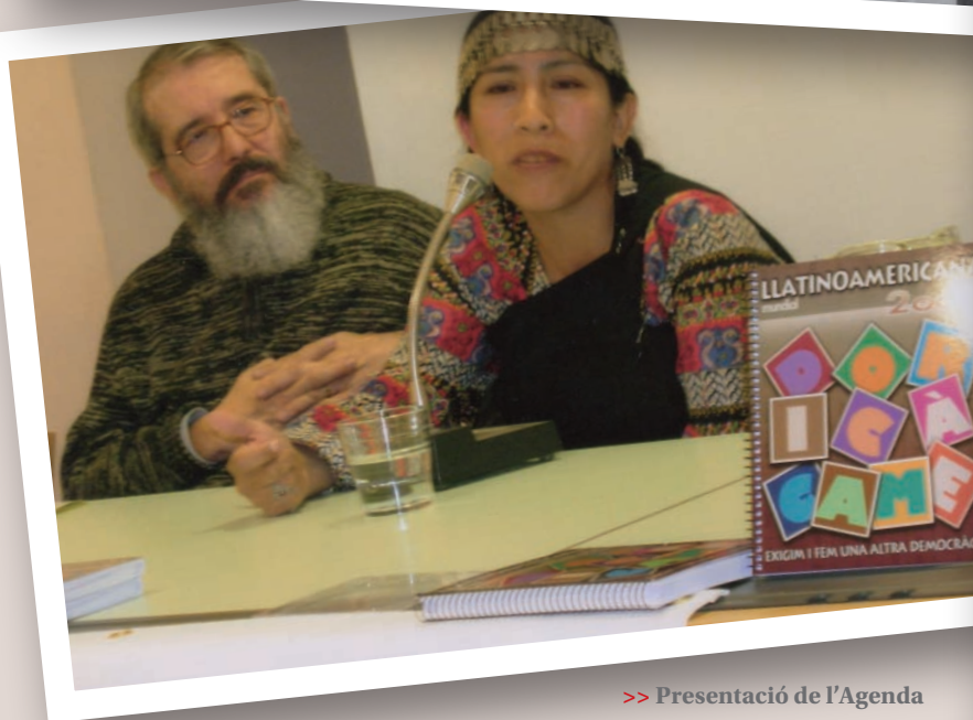
>> Presentació de l'Agenda Llatinoamericana a Girona, tardor de 2006.