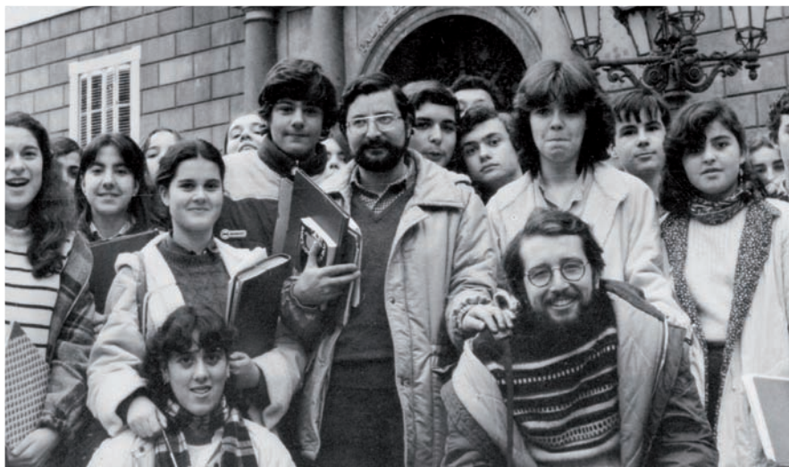
>> Davant el Palau de la Generalitat, a la plaça de Sant Jaume de Barcelona, amb alumnes de l'Institut Santiago Sobrequés de Girona del curs 1981-1982. A sota, a la manifestació «Salvem el Ter» a Torroella de Montgrí, el 7 d'agost de 1976.