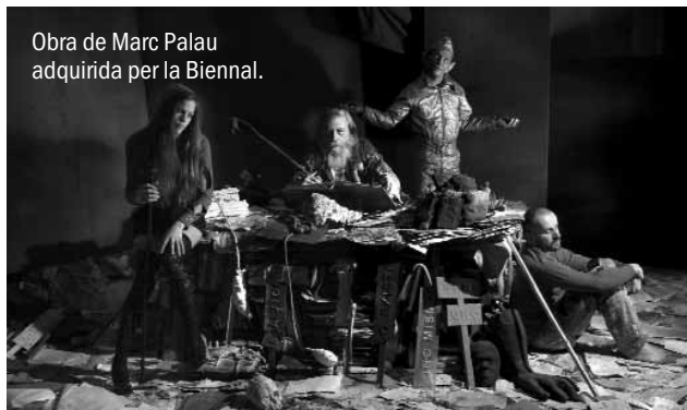
Obra de Marc Palau adquirida per la Biennial.