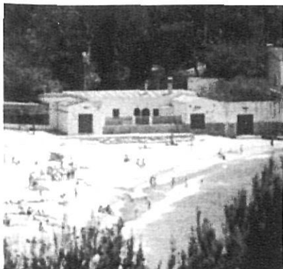
Les cavallerisses de la platja de Castell.

Es tracta no només d'una peça única, sinó de la primera que va fer un cop acabada la seva llicenciatura en arquitectura, aquell mateix any 1929, i on les rajoles en forma d'angle superior sumen precisament 29, així com les romboïdals del primer pis de l'estudi de Sert vora el mar, construït posteriorment, en sumen 30. Són dates que demostren que Josep Lluís Sert va arribar a mas Juny amb gran empenya per restaurar-lo, reconstruir la que després va ser la «Caseta d'en Dalí» (d'en Roura), com també edificar i reconstruir l'estudi de Sert a tocar de la platja i fer, de nova planta, la peça més remarcable del pas de l'arquitecte internacional per Palamós: les Cavallerisses, avui en estat d'abandó penós i injustificable.