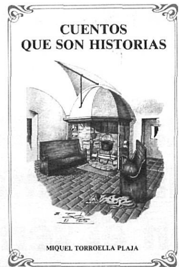
La reedició de 1993 de l'obra de Miquel Torroella.

«Jo no tinc pas edat per haver vist aquest llibre mentre es mantingué a la casa de la vila. Però els que l'han vist afirmen que era una peça de gran valor. A part del valor sentimental inestimable que per a nosaltres de Palafrugell pot tenir, era una joia bibliogràfica, una obra d'art prodigiosa.