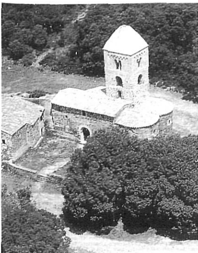
L'església romànica de Santa Coloma de Fitor.

«El cert és que el Llibre de Privilegis no fou tornat mai més.