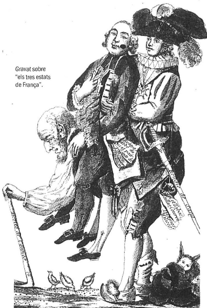
Gravat sobre "els tres estats de França".

senzill i auster, treballador sofer i infatigable de la terra, cultivador d'una fe genuïna, allunyat de la vida regalada i llicenciosa d'altres estaments o d'altres indrets, com ara la cort o la ciutat, i que encarna, en suma —o fins i tot en exclusiva, potser—, les veritables virtuts cristianes.