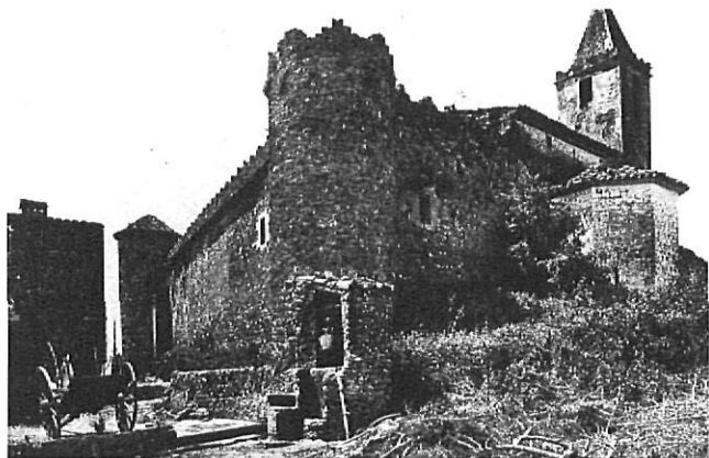
Església i castell de Ravós del Terri.

càrrecs del comú, sinó que atorguen els drets d'entrar als comunals, font bàsica en unes economies que en depenen estretament. A les planes empordaneses, tot i que els comunals i els usos i pràctiques comunitaris estan regulats per la universitat, fa l'efecte que hi ha una major representació; en tot cas caldrà assegurar una estada a la població per tenir drets, i sobretot aquests seran vedats als de fora. Els de fora que tinguin drets de propietat a la universitat —els terratinents, en la terminologia de l'època— podran gaudir dels mateixos drets, sempre, però, que contribueixin als «mals i càrrecs de la universitat»: la universitat es constitueix com una unitat contributiva, on qui contribueix té dret d'accés als usos i pràctiques comunitàries, i qui no ho fa —per estar-ne exempt en disposar de privilegis de ciutadà honorat o de familiar del Sant Ofici— en queda exclòs. És habitant del lloc, però sense poder participar del govern de la universitat i, molt menys, de poder gaudir dels usos i béns comunals.