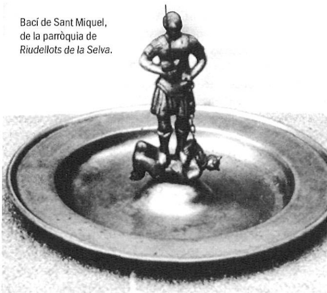
Bací de Sant Miquel, de la parròquia de Riudellots de la Selva.