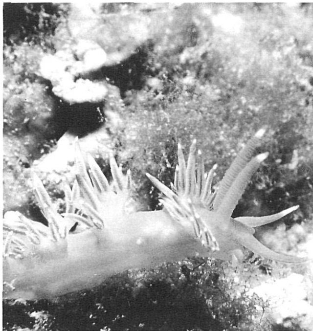
Els nudibrànquids són llimacs submarins que presenten formes i colors sorprenents, com aquesta Flabellina affinis .

palla, fer èmfasi en aquells elements més característics o singulars i localitzar àrees d'interès o sectors de risc, sempre amb el darrer objectiu d'implementar mesures de protecció, vigilància o afavoriment de les espècies i els ecosistemes.