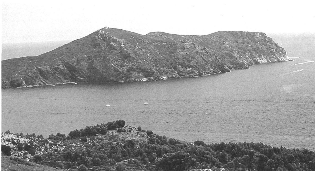
El cap Norfeu és una de les zones amb més riquesa biològica del conjunt del cap de Creus. El Pla Especial ha d'identificar tots aquests valors, preservar-los i potenciar-los adequadament.

protecció i regulació més adequades per a la seva conservació.