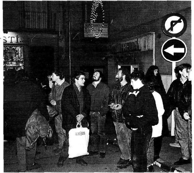
Acció contra la Llei d'objecció i el servei militar a Olot, l'any 1988.

El títol que hem triat és una de les moltes frases utilitzades en la dècada dels 80 per a reivindicar l'objecció de consciència. En aquells anys, una característica de molts dels objectors era la seva procedència o la seva vinculació amb moviments associatius i reivindicatius de caràcter divers: cristians, independentistes, de barris (a Barcelona), ecologistes, llibertaris... Tot i les diferències en les estratègies de lluita i en les vies de solució que es proposaven (servei civil alternatiu, servei civil com un primer pas, o «cap servei, ni civil ni militar»), els objectors coincidien en uns posicionaments ideològics marcadament antimilitaristes i en la utilització de la via de la desobediència civil. Eren els anys previs a la publicació de la Llei d'objecció de consciència i el moment en què els objectors estàvem en situació de incorporación aplazada . A la Garrotxa, molt a principi dels 80, devíem ser una desena. Eren uns moments en què socialment l'objecció era encara una posició no acceptada obertament; encara es temia l'estament militar.