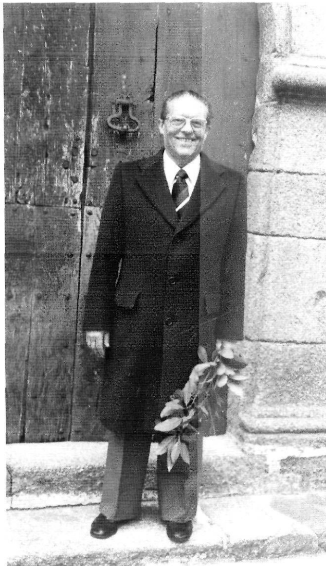
Ministral el diumenge de Rams, l'any 1974.