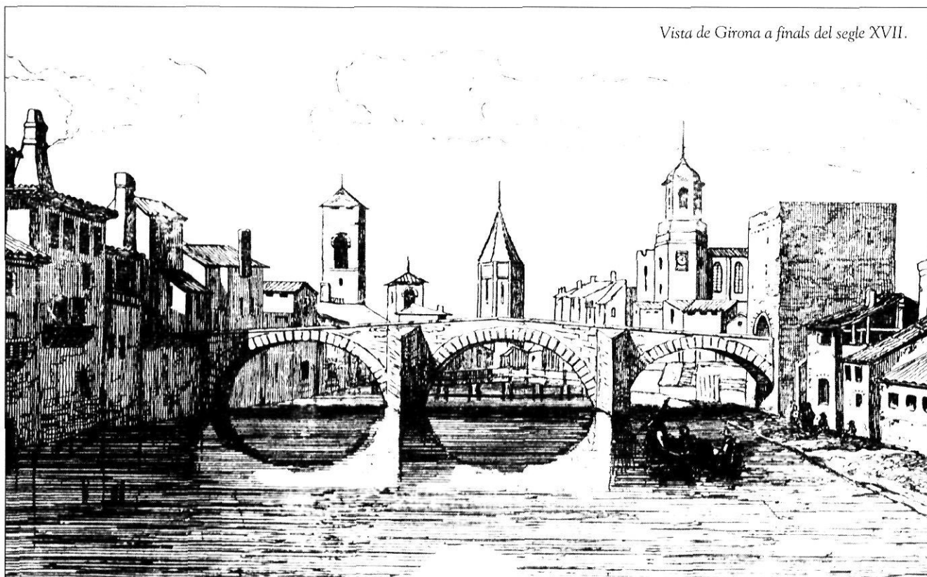
Vista de Girona a finals del segle XVII.

El 1780, per exemple, els habitants dels pobles de Garrigoles i les Olives, que entre tots dos no sumaven mig centenar de cases i menys de dos centenars d'habitants, distants entre si un quart d'hora, plantejaren establir una escola de primeres lletres per als nois i les noies ja que «entre ellos apenas hay quien supiese leer y escribir; motivo de ser malamente desempeñados los cargos concejiles y no mui bien cumplidas las órdenes superiores». Per a portar a terme aquest projecte aconseguiren que Sa Majestat els concedís la facultat d'imposar un tribut d'una vintena part dels fruits resultants de la collita, fins a aconseguir un fons que, afegit a les 800 lliures que havia consignat el prevere de la catedral de Girona Pau Ros, fos suficient per a invertir en censals que mantinguessin dignament un mestre, quantitat que s'estimava entre 130 i 150 lliures. Atesa la urgència del projecte, els dos poblets s'uniren en el finançament del mestre, però es van veure obligats a trencar la seva aliança perquè tant els habitants de Garrigoles com els de les Olives volien que el mestre impartís les lliçons en llurs pobles respectius. Ja que a ningú no va agradar la solució de situar els estudis en un punt intermedi entre ambdós llocs, els pobles van decidir