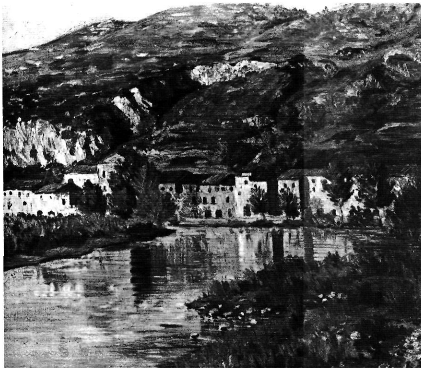
Una altra vista de Pedret, de Francesc Gallostra.

La seva concepció estètica, en la línia del racionalisme i de l'art-déco,