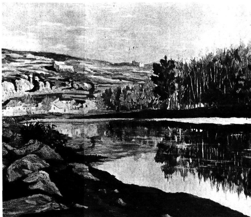
Pedret i Montjuïc, vistos per Francesc Gallostra.