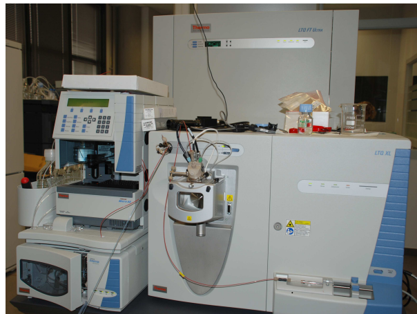
Figura 2: La plataforma d'espectrometria de masses és una de les quatre que ha posat en marxa l'Institut durant l'any 2007

Els grups de Química i Farmacologia Molecular s'especialitzen en el disseny i la síntesi de petites molècules i macromolècules que es poden utilitzar com a sondes de proteïnes. El programa posa un èmfasi especial en la química combinatòria. Un primer enfocament inclou elaborar biblioteques de substàncies i optimitzar els mètodes per produir-les; i un segon enfocament permetria entendre com els medicaments afecten les molècules i com caldria modificar-los per controlar-ne millor els efectes. El programa de Biologia Cel·lular i del Desenvolupament estudia com la informació en el genoma és utilitzada per crear estructures dins la cèl·lula, per guiar la formació i la