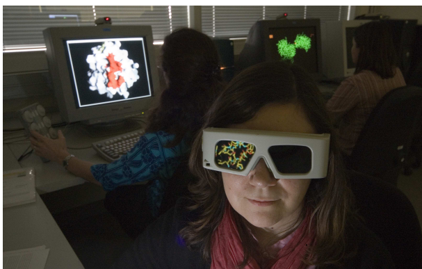
Figura 1: Estudiants de doctorat del programa de Biologia Estructural i Computacional de l'IRB

L'objectiu de l'IRB Barcelona explica la selecció dels diferents elements que el componen. La recerca científica està dividida en cinc programes diferenciats i alhora col·ligats: Biologia Estructural i Computacional, Química i Farmacologia Molecular, Biologia Cel·lular i del Desenvolupament, Medicina Molecular i Oncologia. La definició dels programes de recerca respon a cinc àrees prioritàries de la biomedicina i s'han dissenyat amb visió de futur, amb la possibilitat de créixer o reestructurar-los segons les noves oportunitats que sorgeixin. El programa de Biologia Estructural i Computacional comença en el nivell molecular i estudia l'estructura de molècules individuals i les seves interaccions. Els mètodes usats deriven de la física i de la computació: raigs X, RMN, microscòpia d'electrons, biofísica macromolecular, bioinformàtica i modelització molecular.