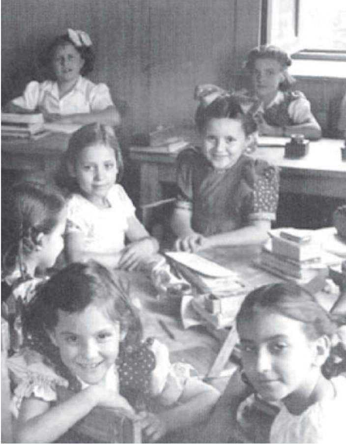
Nenes espanyoles exiliades a Mèxic.

les subjectivitats alienades i les modalitats d'atenció a la salut mental dels exiliats (Kàtia Lurbe).