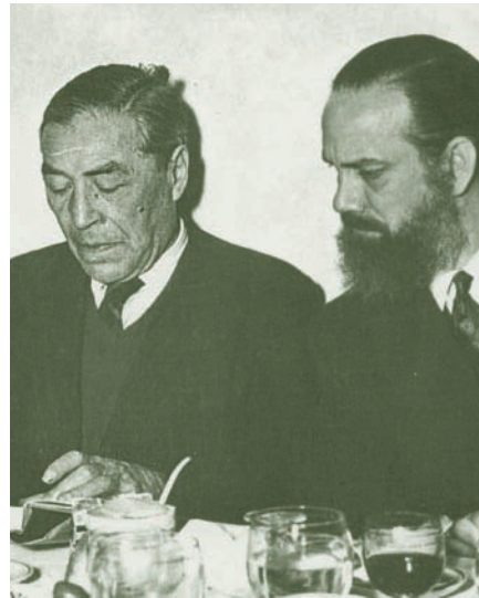
Josep Pla i Camilo José Cela, autors ambdós que van reflectir en les seves obres la petja del temps, tant en la societat com en els paisatges agraris.

Pla vol fer veure els rastres de la civilització mediterrània en el paisatge agrari: "En els camps ben cultivats, hi veig la mateixa civilització que en els llibres de les persones sensibles" (1991a:178). La civilització és el treball humà acumulat sobre el paisatge, és la superposició d'esforços fets per cada