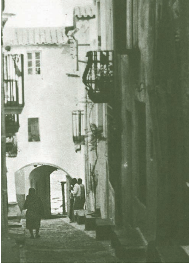
La vida dels pobles de l'Empordà esdevingué un element de primer ordre per a Pla per tal de conèixer com el temps s'ha materialitzat. Imatge de Cadaqués en els anys seixanta del segle xx.

no és més, segons ell, que la substitució de la qualitat que tenien les coses antigues per la quantitat característica del sistema de producció capitalista que introdueix criteris de productivitat industrial en l'agricultura. Vegem-ho amb un exemple.