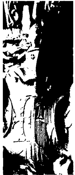
El cicle llegendari del rei Jaume I és el més vast, ric, complex i difós per les seves múltiples implicacions tant en la cultura com en la mateixa geografia de Mallorca. Fotografia: representació escultòrica modernista de fons medieval a l'Hospital de la Santa Creu i Sant Pau (Barcelona).

1. L'heroi és fill il·legítim / 2. La mare és filla d'un rei nadiu / 3. El pare és un rei estranger o un déu /