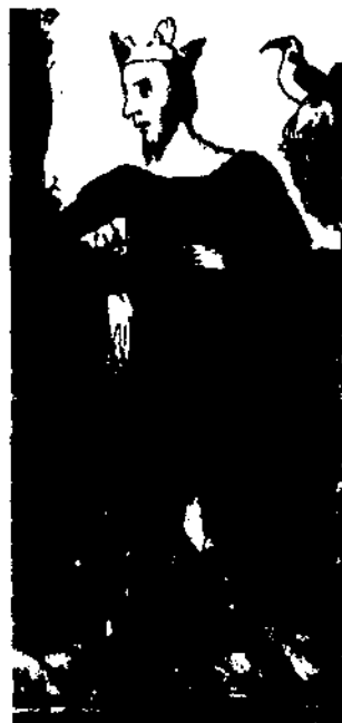
Malgrat els materials folklòrics recollits a partir del segle XIX, manquen encara estudis sobre l'aportació d'aquests materials a la cultura en general (ideologia, literatura, etc.) com és el cas de tot el que fa referència al cicle llegendari del rei Jaume I. Fotografia: imatge de Jaume I.

És, evidentment, un retrat idealitzat que s'inscriu dins els tòpics literaris que descriuen la bellesa segons un canó determinat (els cabells d'or, les dents de perles, els ulls clars, etc.), ja usual en època medieval i que ha perviscut fins a l'actualitat. Però aquesta descripció, que retrobam feta imatge plàstica en nombroses representacions iconogràfiques del Conqueridor, ja ens proporciona les línies mestres sobre les quals es desenvoluparà la imatge mítica del monarca. És el retrat d'un heroi, talment com el farien avui els més anomenats directores de cinema d'aventures de Hollywood. Talment com l'haurien descrit els cronistes de l'Antiguitat clàssica. Just i fet com l'hauria dibuixat un arrauxat autor romàntic. És el rei En Jaume I, de sobrenom el Conqueridor, el nostre heroi èpic més paradigmàtic i complet. Les cròniques medievals –inclosa la que ell mateix compongué– ja mitificaren aquest personatge i la memòria popular ha fet exactament el mateix. Cisellar un cop i un altre, a còpia de llegendes i tradicions, de transposicions i préstecs, la fisonomia d'un heroi equiparable als més alts herois de la cultura occidental, tant literaris com històrics: Èdip, el rei Artús, l'emperador Carlemany, el Cid Campeador, etc. Però, tant les fonts