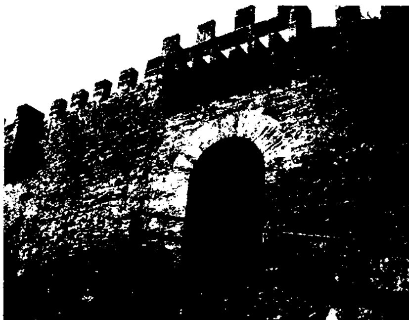
La petja mítica d'en Jaume I ha significat que a Mallorca es crearen un nombre notable d'indrets de referència quasi ben bé mítics. Fotografia: la porta del rei En Jaume al castell de Capdepera (Mallorca).

No hi ha cap llegenda relacionada amb els matrimonis del rei.