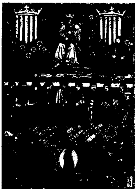
Totes les representacions i cròniques sobre Jaume I sempre han transmès una imatge enaltidora del rei i de la seva manera de viure i governar. Fotografia: Jaume I presidint una reunió amb els seus consellers.

entorn de Jaume I s'acosta o s'allunya del paradigma mític.