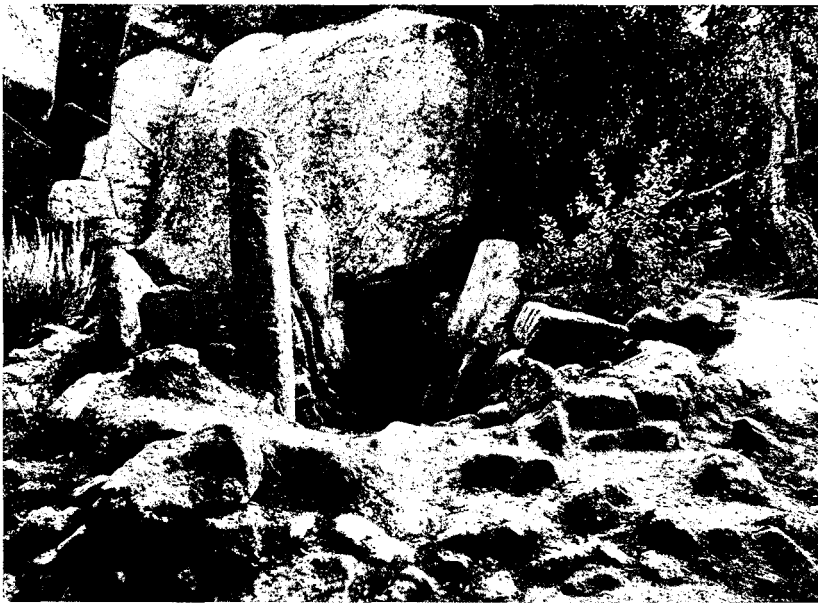
Els monuments funeraris més antics que coneixem pertanyen a la cultura megalítica de la qual és exemple el paradolmen de Pedra Sobre Altra a l'Ardenya

nopoli de la mort, de l'autoritat eclesiàstica al poder municipal, la qual cosa va provocar seriosos enfrontaments entre les dues institucions com va passar a Palafrugell, a Olot o a Cassà de la Selva, entre altres exemples que podríem esmentar.