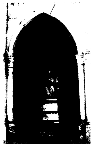
La propietat i la privadesa de la llar dels rics es trasllada als cementiris vuitcentistes com ens fa avinent la imatge del cementiri de Sant Feliu de Guíxols

L'any 1787 Carles III va ordenar la construcció dels cementiris fóra de les poblacions (que incloïa la prohibició de donar sepultura a l'interior de l'església) adduint raons higièniques i sanitàries. De totes maneres la disposició de no enterrar a l'interior de les esglésies es va incomplir reiteradament, i la substitució dels antics camps sants per nous recintes allunyats de les poblacions no es va generalitzar fins a mitjan el XIX tot i que encara actualment en les poblacions de reduït pes demogràfic els cementiris es localitzen a l'entorn del temple i al bell mig del poble (Toses, Olopte, Guils de Cerdanya, Valldevià, etcètera). Tot i amb això, l'aplicació d'aquesta llei (de la qual en derivaren nombroses altres durant tot el segle XIX) va tenir una gran transcendència tant des d'un punt de vista urbanístic com jurisdiccional. Des d'un punt de vista urbanístic va comportar l'alliberament d'un espai al centre del poble, les actuals places a l'entorn de les esglésies, que recuperaven les antigues sagreres com a espais públics, vitals i dinàmics tal com ho havien estat durant l'edat mitjana. Des d'un punt de vista jurisdiccional va comportar el traspàs de poders en el mo-