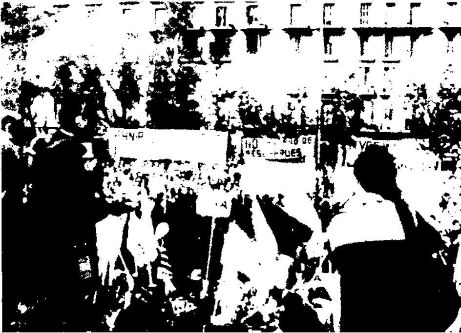
La qüestió de l'aigua a Espanya ha estat històricament problemàtica donades les característiques físiques del territori peninsular, especialment en aquells indrets que han sentit sempre que les seves principals riqueses eren explotades per altres, com és el cas de les poblacions pirinenques. Fotografia: grups de la Chunta Aragonesista manifestant-se en contra del Pla Hidrològic Nacional, a Barcelona.

dicals, el moviment ecologista i, fins i tot, experts que mantenen punts de vista diferents. En general, el que s'ha creat han estat dos camps que no són absolutament impermeables, però que estan ben definits i que situen en un costat els opositors i en un altre els defensors d'aquests grans projectes hidràulics. Aquest és un breu resum per a una activitat de quasi una dècada d'investigació que, en termes generals, s'ha concentrat en les conseqüències de la política de l'aigua que ha predominat a Espanya i especialment a Aragó al llarg del segle XX.