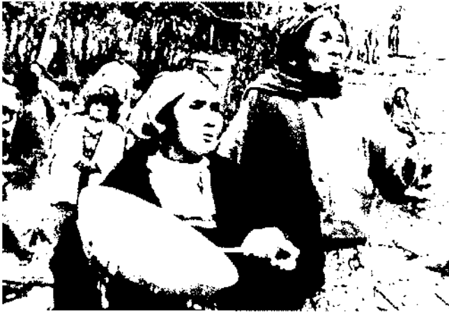
Dones mapuches (Xile) manifestant-se contra la construcció d'una presa que havia d'inundar les seves terres (setembre de 1999): la globalització dels conflictes locals.

Finalment i de manera molt intensa, els moviments d'oposició, a més de l'administració responsable, també s'han enfrontat amb la Confederació Hidrogràfica de l'Ebre, l'òrgan administratiu que exerceix les competències exclusives de l'Estat en la gestió i planificació de l'aigua en tota la conca de l'Ebre.