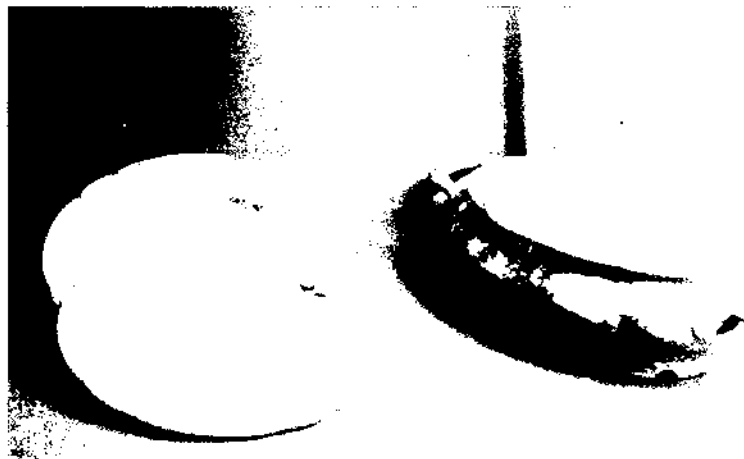
Bodegó de vaixel·la antiga.

per certs objectes, és a dir treballar la cultura material, amb alguns sectors de població diferenciats i amb les pròpies famílies, ens permet, sens dubte, treure conclusions sobre la necessitat de preservar el patrimoni comú, com dur a terme aquesta iniciativa i com organitzar-ne la difusió. Els nostres museus etnogràfics com a productes de la primera meitat del segle XX són sovint fruit de l'esforç realitzat per intel·lectuals i del seu interès particular per la recollecció d'objectes. Potser avui, estès el concepte de patrimoni, hauríem de veure què vol fer la societat civil dels seus signes identitaris i donar als ciutadans un marge de confiança a l'hora de recollir material i de difondre'l. D'aquí el nostre apropament progressiu, com a museu especialitzat en temes de vida quotidiana, als barris de la ciutat i a les entitats mitjançant l'organització de seminaris d'informació, de tallers i d'altres activitats relacionades amb la