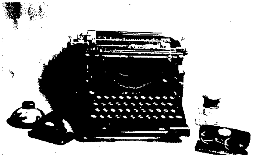
Bodegó de detalls d'escriptori i ulleres antigues.

per certs objectes, és a dir treballar la cultura material, amb alguns sectors de població diferenciats i amb les pròpies famílies, ens permet, sens dubte, treure conclusions sobre la necessitat de preservar el patrimoni comú, com dur a terme aquesta iniciativa i com organitzar-ne la difusió. Els nostres museus etnogràfics com a productes de la primera meitat del segle XX són sovint fruit de l'esforç realitzat per intel·lectuals i del seu interès particular per la recollecció d'objectes. Potser avui, estès el concepte de patrimoni, hauríem de veure què vol fer la societat civil dels seus signes identitaris i donar als ciutadans un marge de confiança a l'hora de recollir material i de difondre'l. D'aquí el nostre apropament progressiu, com a museu especialitzat en temes de vida quotidiana, als barris de la ciutat i a les entitats mitjançant l'organització de seminaris d'informació, de tallers i d'altres activitats relacionades amb la