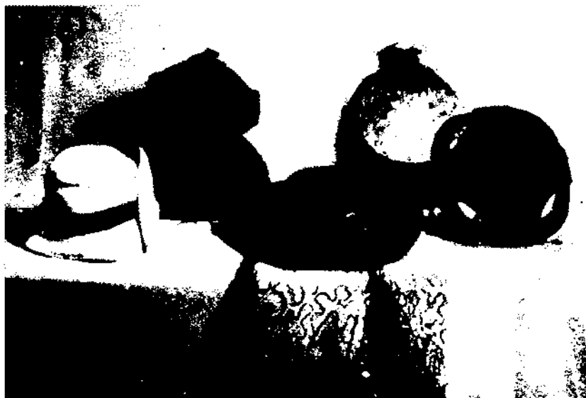
Bodegons de barrets antics.