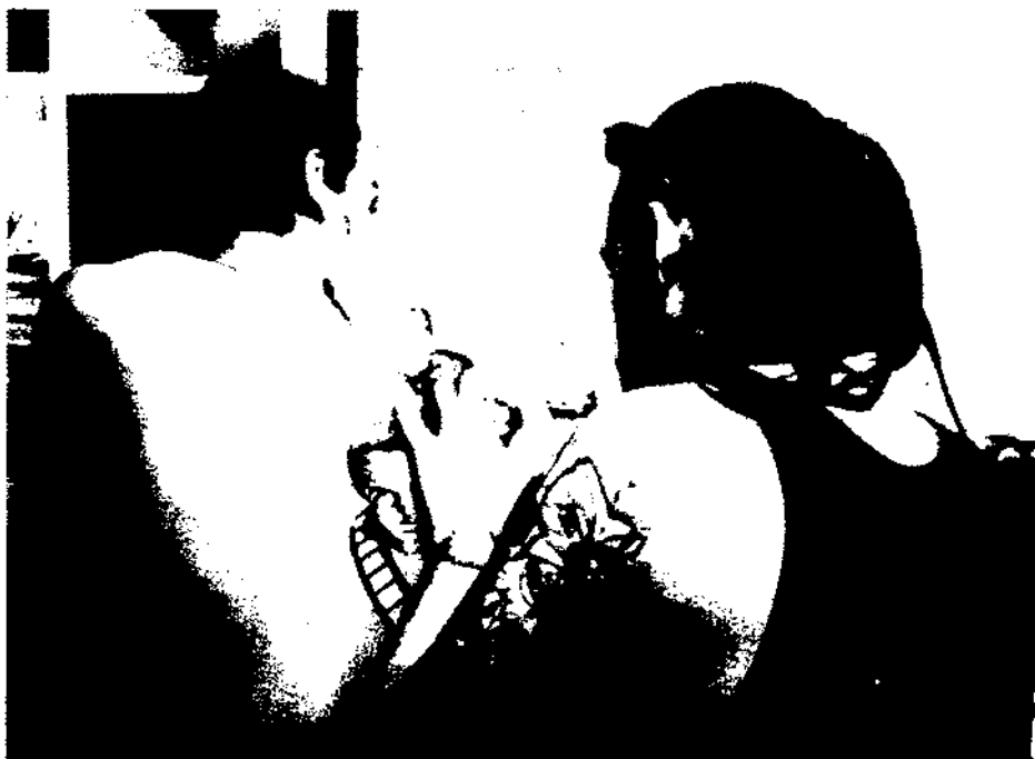
La complexitat de la nostra societat comporta la recerca de noves formes d'identificació entre els joves com les relacionades amb les modificacions corporals. Tatuatge (Barcelona, 1997)

quals els joves es diferencien entre ells ja no són tan sols de caràcter ideològic, sinó que estan relacionats amb el fet de percebre's diferents, desenvolupant un estil de vida en la diferència mitjançant atributs que assimilen en si mateixos.