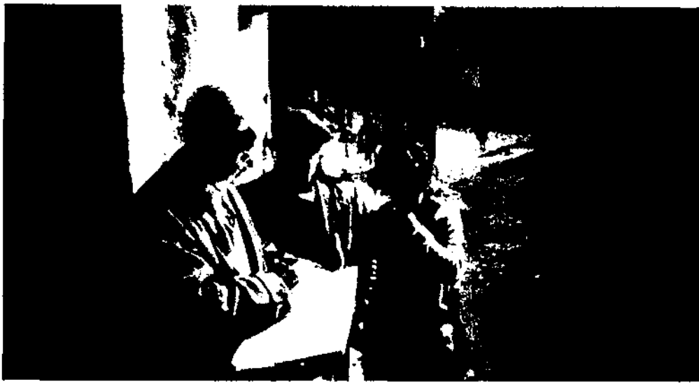
Caro Baroja fent treball de camp en els anys cinquanta.

lore (1949). Es tracta d'una obra l'origen de la qual és un curs sobre Iniciación a la Etnología y al Folklore impartit el 1946 a Barcelona. Molt ampliada amb posterioritat per fer-ne la publicació, s'hi fa una anàlisi crítica del funcionalisme, quasi en la mateixa mesura que de l'escola historicocultural. S'hi rebutja el difusionisme d'aquesta darrera escola a causa de la selecció unilateral dels elements que fa, i el funcionalisme pel seu antihistoricisme; Caro Baroja comença a defensar allò que serà una constant del seu pensament a partir d'aquest moment: una etnologia de caràcter històric. 9 Malgrat tot, la familiaritat amb el funcionalisme més nou de l'època, el de Radcliffe-Brown i Malinowski, no sembla excessiva, ja que a penes són citats en l'obra; per contra, Durkheim és l'autor d'aquesta tendència al qual presta més atenció.