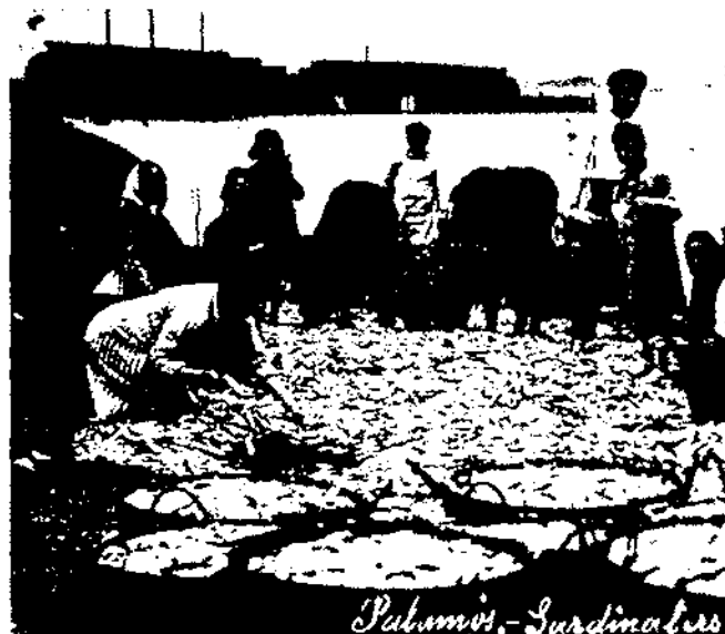
Palamós: classificació de la pesca.

Una nau que servia de magatzem, adossada a la casa, va convertir-se en la sala d'ús polivalent, primer espai públic del centre amb la missió de permetre concretar la imatge del museu dins la població, poder organitzar exposicions temporals i donar cabuda a totes