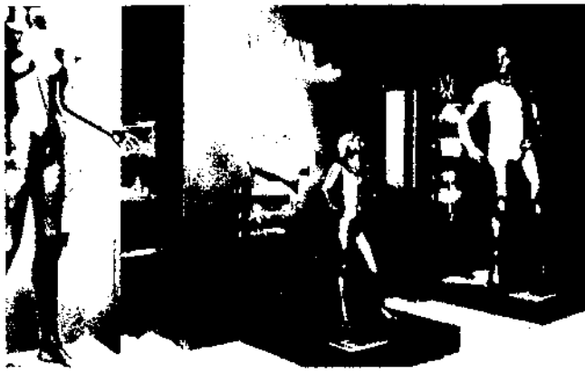
La nova museologia vol aconseguir una major interpel·lació entre l'espectador i allò que li és mostrat. Exposició: Temps perdu, temps retrouvé (Museu d'Étnografia de Neuchâtel, 1985).