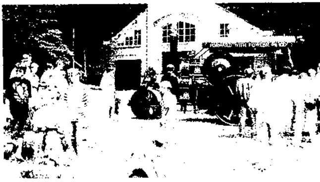
Museu a l'Aire Lliure dels Països Baixos (Nederlands Openluchtmuseum): el museu esdevé lloc de trobada i de dinamització de la comunitat.