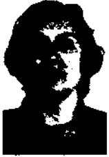
Carme Fauria Roma Museu Etnològic de Barcelona

La trajectòria dels museus etnològics a Catalunya s'ha caracteritzat per les mancances i la precarietat. A hores d'ara, cal reflexionar, a partir de l'anàlisi d'altres situacions similars, quins poden ser els remeis més efectius.