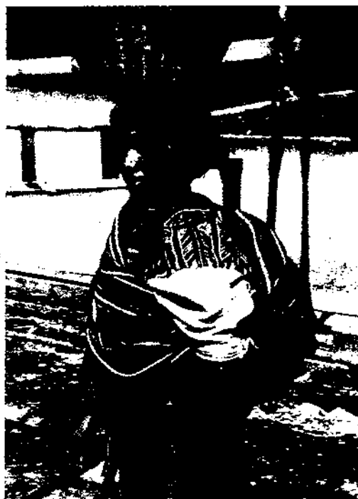
Vostre arxivament de Archa: Etnogràfic

Dins el camp concret dels museus etnològics es