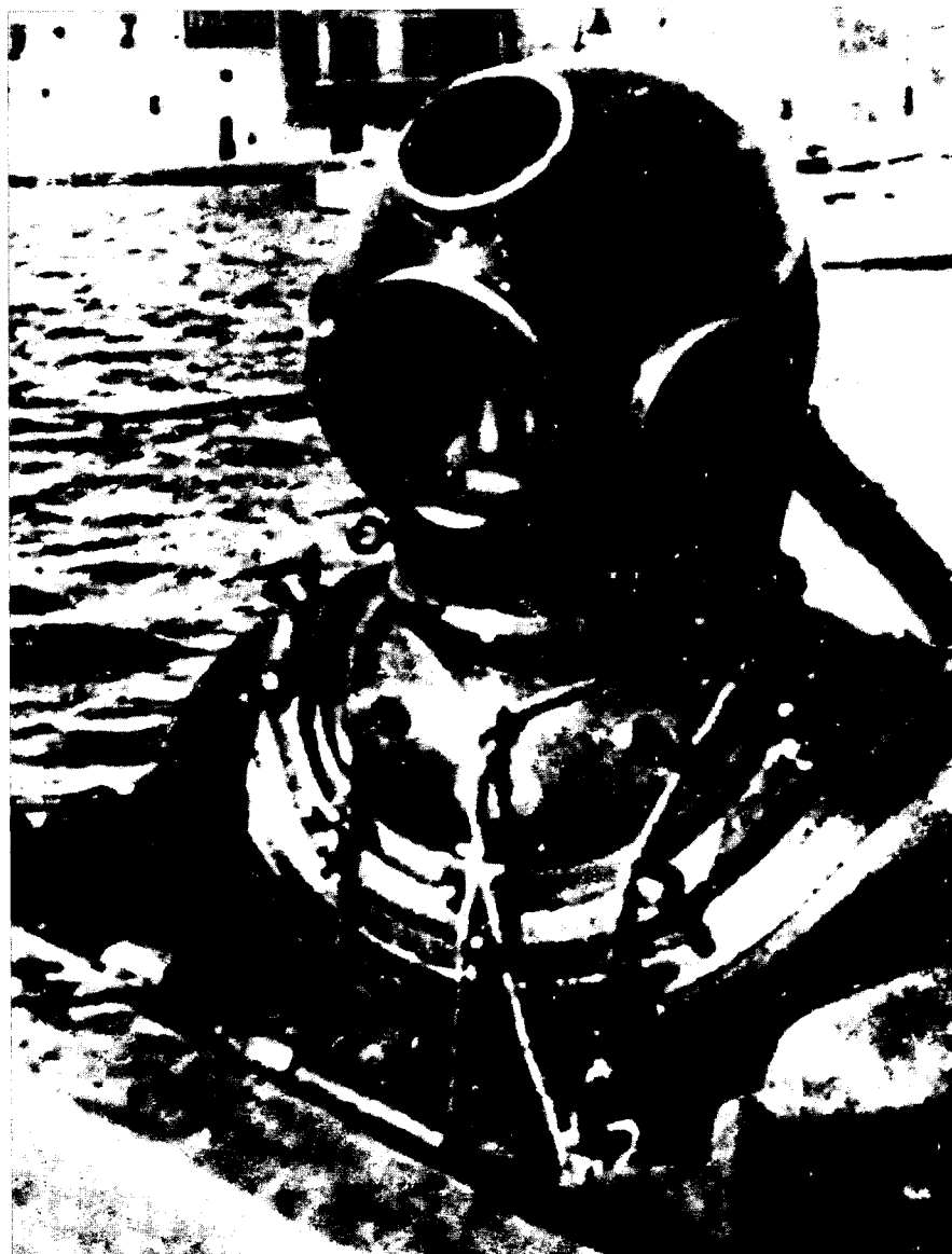
Equipament per a la pesca del corall a la Costa Brava.

La mostra s'inseria en la proposta del Museu de la Pesca que, en l'espera de poder oferir una exposició permanent dedicada a l'activitat pesquera de la Costa Brava, aprofita les exposicions temporals per difondre dife-