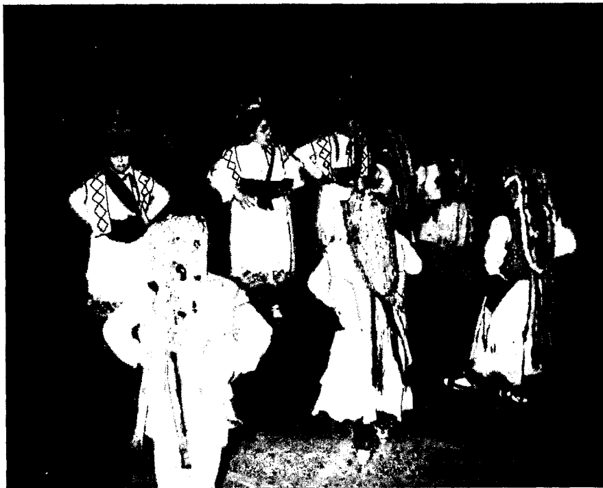
Ball dels Garrofins de la vila de Moià. Recerca realitzada per Glòria Ballús i Maria Antònia Juan.

clusiu de la literatura popular. Els goigs són el segell patent d'una època, arrel·len en la natura, enllacen amb creences ancestrals, mostren l'evolució històrica i, per tant, plasmen, mitjançant dibuixos, lletres i música, la manera d'entendre i d'interpretar els fets, sovint inintel·ligibles. Són, en definitiva, una valuosa mostra de la vida d'una comunitat i patrimoni de la seva llengua i de la seva cultura.