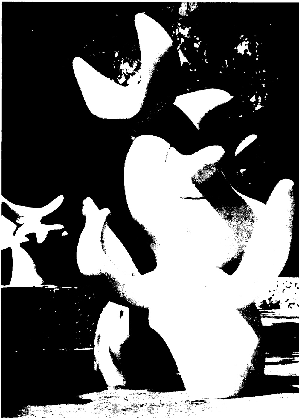
Ocell solar i Ocell lunar.

un dels seus textos, «Miró ha sintetitzat, en l'àmplia corba del seu procés creador, la influència de l'art infantil, de la prehistòria en el seu període esquemàtic i de certs aspectes de l'art popular, integrant tot això en un idioma plàstic d'una originalitat i un efectisme profunds», i ha conformat, a més, una suggeridora acció creativa que esvaeix els límits i la proverbial i interessada escissió entre la producció artística «cultura» i les manifestacions plàstiques de la cultura popular.