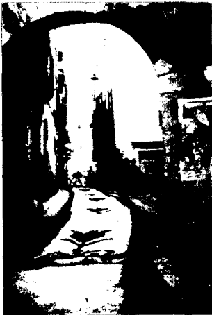
Catifa de flors a Mont-roig amb motiu de la festa de la Mare de Déu de la Roca.

ció de les arts populars. Per una banda, des de l'àmbit del folklore i de l'etnografia (Joan Amades, Pau Vila, Tomàs Ragner, etc.), se n'iniciaren i se'n realitzaren les primeres recopilacions i els primers treballs monogràfics; i, pel que fa al món artístic, a més de les iniciatives de Joaquim Folch i Torres en pro d'un Museu d'Art Popular, cal fer esment de la recreació idealista de motius populars que feren els artistes i artesans noucentistes que porten implícita moltes d'aquestes manifestacions, que dugueren a terme el GATPAC (Grup d'Artistes i Tècnics Catalans per a l'Arquitectura Contemporània) i l'ADLAN (Amics de l'Art Nou).