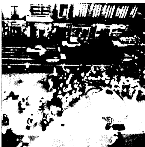
Mosaic de Joan Miró al pla de l'Os a la Rambla de Barcelona: la inspiració en les catifes de flors hi és ben palesa.

un dels seus textos, «Miró ha sintetitzat, en l'àmplia corba del seu procés creador, la influència de l'art infantil, de la prehistòria en el seu període esquemàtic i de certs aspectes de l'art popular, integrant tot això en un idioma plàstic d'una originalitat i un efectisme profunds», i ha conformat, a més, una suggeridora acció creativa que esvaeix els límits i la proverbial i interessada escissió entre la producció artística «cultura» i les manifestacions plàstiques de la cultura popular.