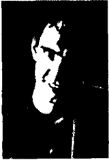
W. A. Christian Jr. Traducció de l'anglès: Núria Martí

L'autor ens ofereix un seguit de reflexions sobre el color de les imatges, el seu simbolisme i el conjunt de vivències i sentiments que afavoreixen o dificulten la identificació amb la Verge de Montserrat.