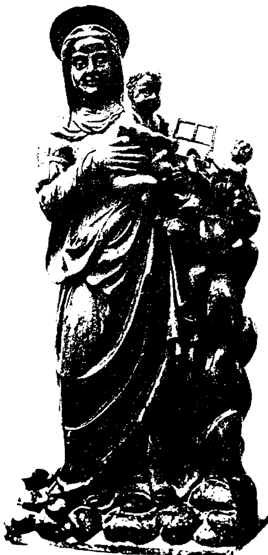
Imatge barroca de la Mare de Déu de Montserrat que presidia l'altar major de l'església de Santa Maria de Castellfolit de Riubregós.

l'ajuda pràctica constitueix gran part del paper que la Mare de Déu representa per a molts pelegrins. Es pot copsar millor en el llibre dels pelegrins que s'ha mantingut des del 1977, tot emulant el de molts santuaris francesos. 23