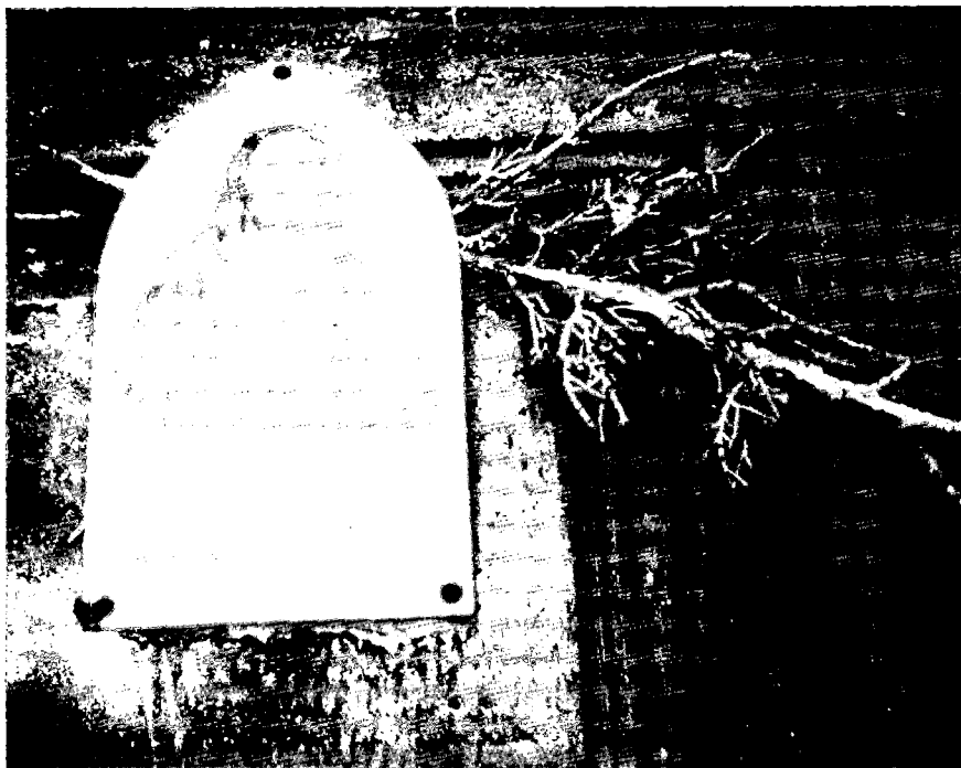
Branca de savina ( Juniperus phoenicea ) a l'entrada d'una casa (Montsec d'Ares). La Savina és una de les espècies amb significat màgic-religiós, que pren caràcter d'element guaridor d'Ares.

profundes arrels populars. El recull s'estructura en tres parts, la primera amb cançons de caire social que representen aspectes reivindicatius, de protesta, satírics, descriptius, etc.; la segona amb cançons lírico-narratives, sentimentals, romàntiques, d'exaltació de la persona i de la terra, caramelles i himnes populars, i la tercera amb cançons de bressol, d'infants, i amb danses, amb una musicalitat i una temàtica tendra.