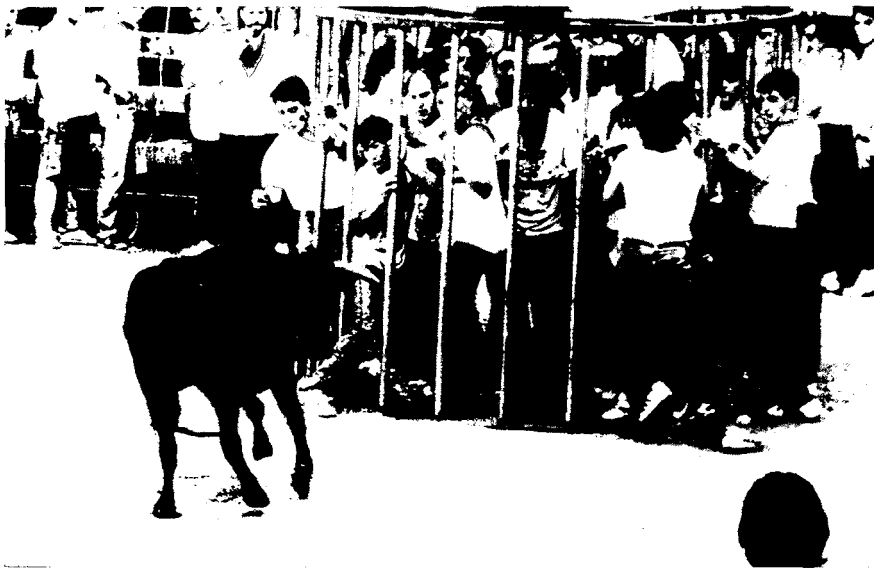
El correbou de Cardona.

lògic i el polític-social. És un estudi complex per la seva interdisciplinarietat i que intenta, en la mesura que pugui, emmarcar la trajectòria de la indústria adobera en períodes concrets de la història. El treball s'estructura en tres parts, i conclou amb un apèndix documental i un de fotogràfic dels estris i dels materials de l'ofici conservats al Museu Comarcal Salvador Vilaseca, de Reus.