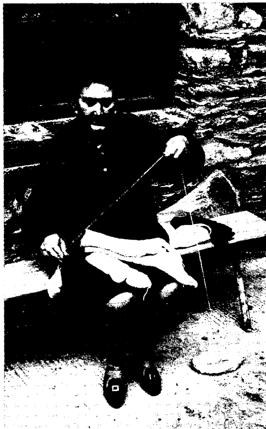
«Resseguir i documentar els canvis de les formes de vida»: una de les tasques de l'Ecomuseu.