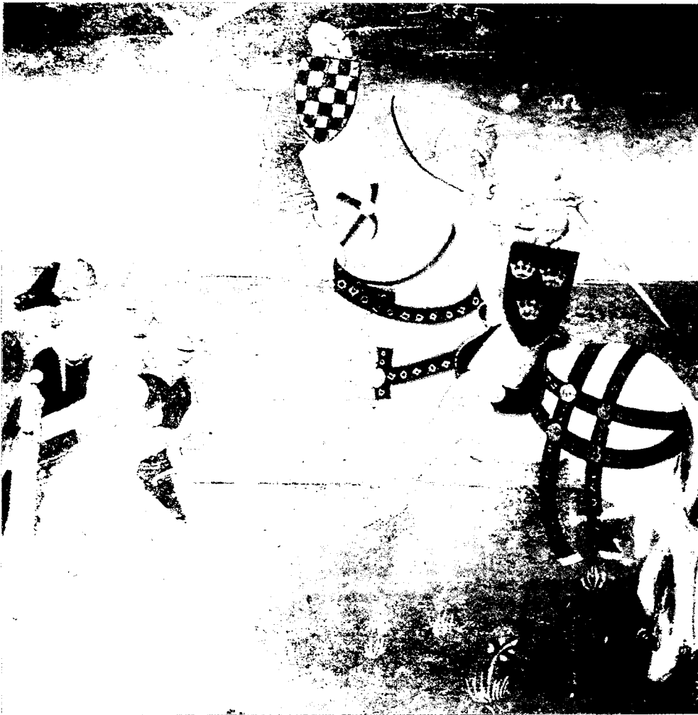
Torneig amb espasa.

tiques — amb tota la seva càrrega d'exhibicionisme i culte a la preparació física — que tant havien agradat als espartans, atenesos i romans es trobaven més a prop del joc de la guerra, de l'entrenament militar, que de la competició lúdico-esportiva que caracteritza les societats actuals. Aquest matís, de tota manera, no disminueix la significació social d'unes reunions que buscaven la superació de l'individu enfront les naturals limitacions somàtiques, en les quals s'aconsegueix un ensinistrament en el maneig de les armes molt necessari a l'hora de guerrear i, d'altra banda, el triomf facilita al guanyador la possibilitat d'escalar llocs en el si de la comunitat.