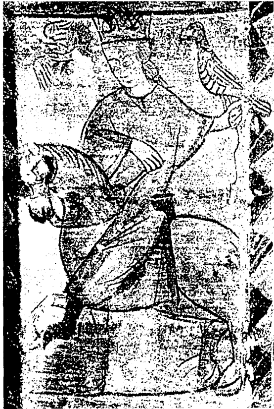
Rei caçant amb el falcó a la mà (pintura mural del segle XIV. Castell d'Alcañiz, Terol).

barcelonins crien a les seves cases de la ciutat són, com és lògic, un dels objectius preferents d'aquests practicants espontanis, provocant la repulsa dels consellers, els quals es veuen obligats des de ben aviat a dictar normes prohibint portar ballestes a la ciutat i a l' Horta i el Vinyet . 30