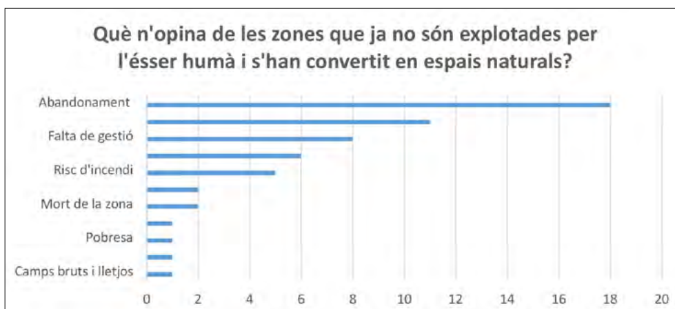
Imatge 2. Sentiments sobre zones que ja no són explotades per la gent i que s'han convertit en zones «salvatges» (nombre de respostes).

Els nostres resultats mostren, a més, que un 32 % dels actors clau associen la manca d'intervenció humana en el paisatge amb l'abandonament o amb la sensació que els humans no tenen cura de la natura (34 %). La proliferació de matollars és vista generalment com un paisatge desolador. La majoria dels entrevistats associen els paisatges agrícoles amb records familiars o amb històries d'una època en què els pobles tenien més habitants i una vida social més intensa. La idea de que les terres que abans