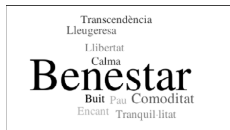
Imatge 3. Sentiments envers l'experiència d'estar en espais naturals expressats pels actors locals. La mida de les lletres expressa la freqüència de categories de la nostra mostra.