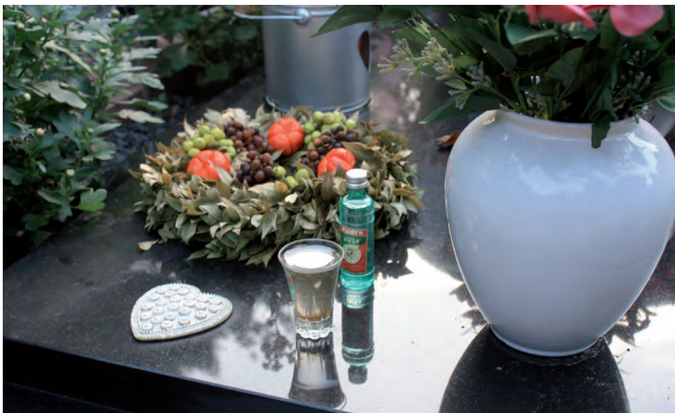
Una beguda per a la persona difunta, deixada en una tomba de Nimega, als Països Baixos.

Aquest text és una versió ampliada d'un article que va aparèixer a l'anuari Jaarboek voor Liturgieonderzoek / Yearbook for Ritual and Liturgical Studies , 32(2016), 9-20.