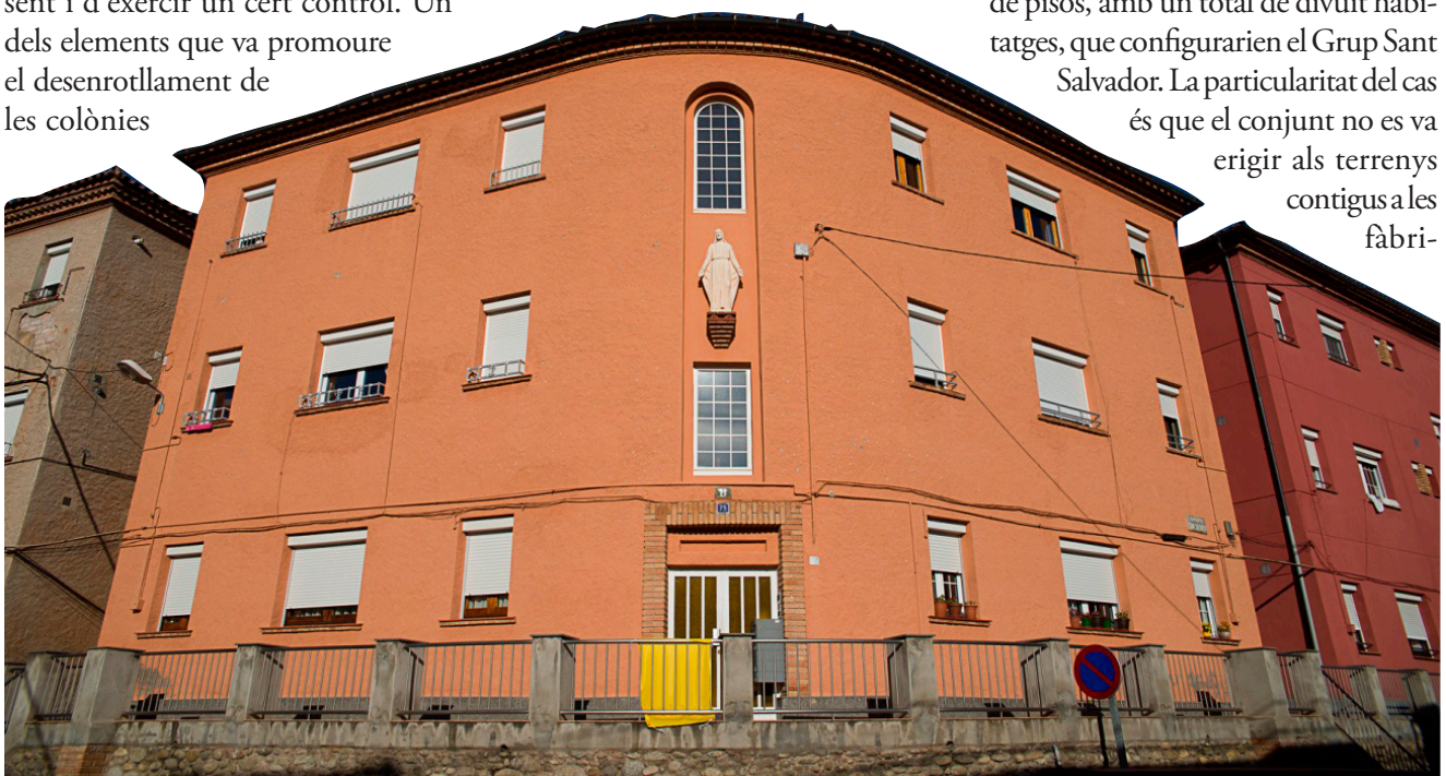
Bloc central del Grup Sant Salvador actualment (2014).

Calia, doncs, oferir a aquesta nova mà d'obra un lloc on viure, i davant d'això Hilaturas Voltregà, S.A. va promoure l'any 1949 la construcció dels tres blocs de pisos, amb un total de divuit habitatges, que configurarien el Grup Sant Salvador. La particularitat del cas és que el conjunt no es va erigir als terrenys contigus a les fàbri-