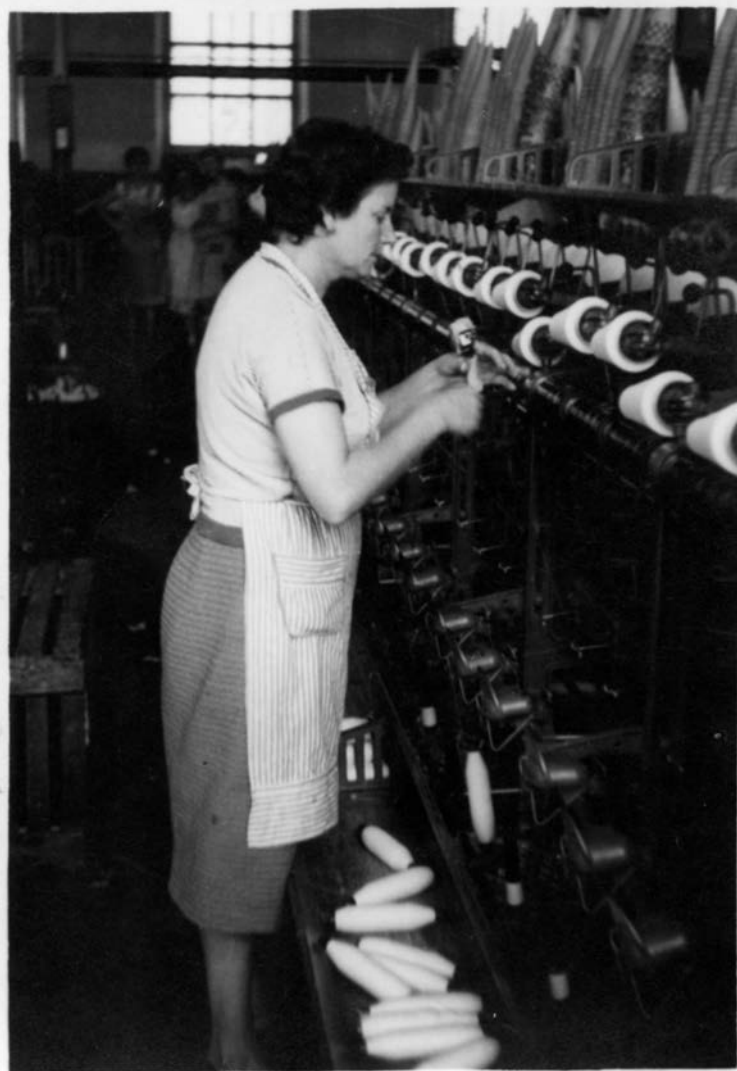
Treballadora a la secció de les metxeres de la Nova (mitjan segle xx).