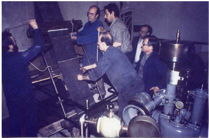
Mecànics de Gallifa arreglant la corretja de la turbina (dècada de 1970).