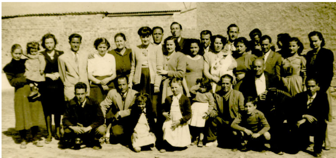
Grup de residents del Grup Sant Salvador al pati del darrere dels blocs de pisos (dècada de 1950).

Amb tot, és evident que el cas de Gallifa constitueix una forma de colònia que difícilment s'ajusta als models paradigmàtics o als de la majoria de colònies del Llobregat. Es tracta d'un cas poc desenvolupat, en el qual tan sols es va donar lloc a un petit grup d'habitatges d'una forma molt tardana i deixant de banda tota la quantitat de recursos i serveis que oferia el model colònia. A més, existia una distribució disseminada d'aquests espais habitaculars que, alhora, constituïa una forma clara de jerarquització laboral: els habitatges dels càrrecs de la fàbrica es trobaven annexos al conjunt fabril ja des de finals del segle XIX, mentre que els pisos dels obrers es van projectar de forma molt tardana i es trobaven el centre de Sant Hipòlit. Gallifa esdevenia un model de fàbrica que restava a mig camí entre la fàbrica urbana i la colònia i que es caracteritzava per la precarietat, la manca de desenvolupament i d'organització urbanística, la dispersió dels espais habitaculars, la manca de serveis i la poca inversió en projectes a llarg termini. Segons la classificació