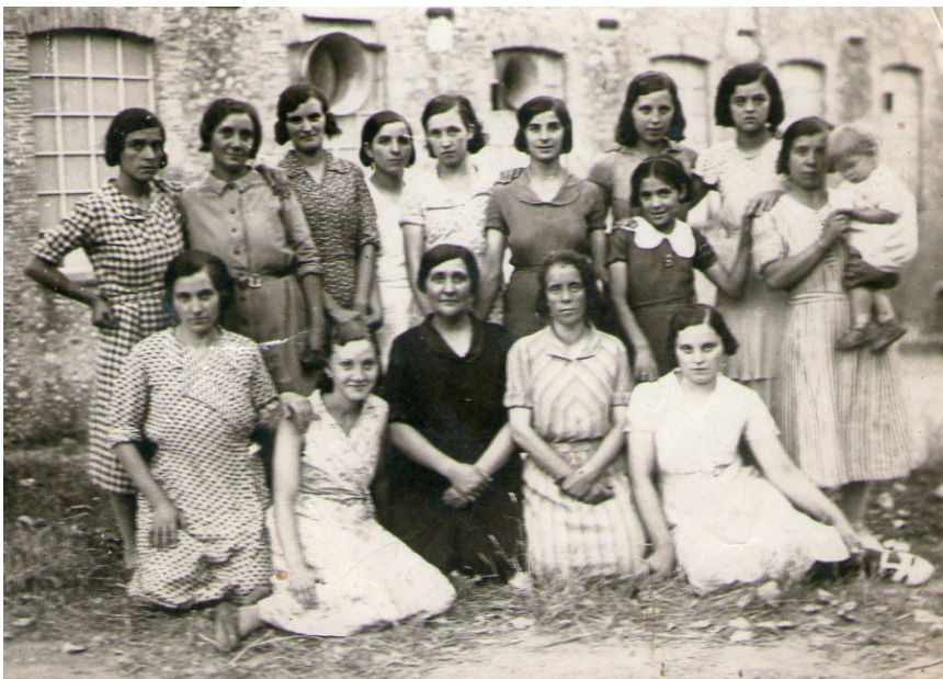
Grup de treballadores de Gallifa a l'exterior de la fàbrica. (dècades de 1950 i 1960).

La incidència que va tenir la industrialització al Voltreganès no va ser menor i és que, segons el padró del 1936, a Sant Hipòlit constaven un total de 576 obrers en una població total de 1.895 habitants. 7 Això significava un 30% de la població, i l'any 1955 el percentatge era d'un 40%, la qual cosa assenyalava ja un canvi en les estructures econòmiques i socials. Dins d'aquestes dades generals del municipi, Gallifa ocupava un 25% de la població dedicada al tèxtil de Sant Hipòlit i les Masies de Voltregà. Quedava clar que aquestes fàbriques constituïen un dels principals