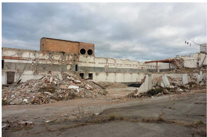
Aspecte actual d'una part de les fàbriques de Gallifa (2014).

És evident, doncs, que quan parlem de les fàbriques de Gallifa estem davant d'un cas en què bona part del patrimoni arquitectònic es troba en vies de desaparició imminent. A un ritme