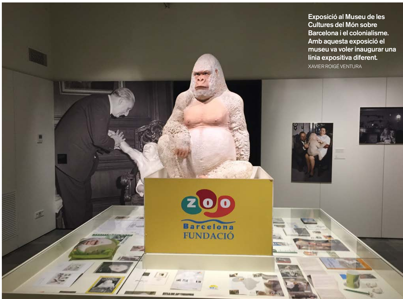
Exposició al Museu de les Cultures del Món sobre Barcelona i el colonialisme. Amb aquesta exposició el museu va voler inaugurar una línia expositiva diferent.

El Pla de museus del 2017 preveu un creixement de la despesa dedicada a cultura en els pressupostos de la Generalitat de Catalunya. Segons els diferents escenaris, preveu un increment des de 39,7 (2015) a 42,4 i 48,8 milions d'euros (2017, p. 188-189).