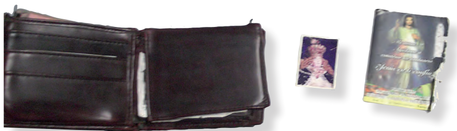
Regal de familiars en el moment de marxar: bitlletera amb estampes religioses. Són portades a la butxaca des de fa deu anys. (FOTOGRAFIA DE L'INFORMANT, 2012.)

d'aquest estudi observar de quina manera la procedència nacional o l'adscripció ètnica i la distància entre origen i destinació influeixen en l'escenari material i en la relació que s'hi estableix. Per seleccionar les procedències, es va utilitzar com a guia les dades del padró d'habitants de l'INE, i es va procurar que cada continent estigués representat. La decisió sobre si entrevistar un home o una dona es va prendre tenint en compte si a cada col·lectiu hi ha un nombre més gran de dones o d'homes.