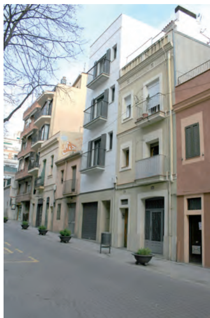
■ Detall de la part inferior del carrer Major, en la qual podem observar diferents tipologies edificatòries que comprenen des de mitjan segle XVIII fins a un any abans de fer-se la fotografia, quan s'edificà el bloc blanc (2012).

l'interior de Catalunya, els aragonesos, els castellans i, més recentment, els europeus i sud-americans; amb els senyors han conviscut els fusters i els paletes; amb els botiguers, els treballadors de les fàbriques; amb els que hi fan vida, els que només hi dormen. De la mateixa manera, hem constatat com en el terreny urbanístic es revelen a Sarrià certes tensions entre àrees diferenciades: entre l'extraradi dels masos i el seus camps, i les cases del nucli i els seus carrerons i places; entre el Sarrià de dalt i el Sarrià de baix; entre el Sarrià «ordenat» i el seu barri Xino ; 9 o entre el nucli i les seves barriades de barraques, com ara la de Can Caralleu. Es tracta de tensions que també es revelen en el camp edificador, especialment palès avui dia davant les diverses tipologies constructives que hi conviuen: masies, cases senyoriales, cases de cós populars, blocs de pisos esgrafats, arrebossats, de maó o de marbre —tot depenent de la moda del moment—, evidència del pas inexorable del temps, però també, com ens destaquen, de la pèrdua d'una fisonomia pròpia.