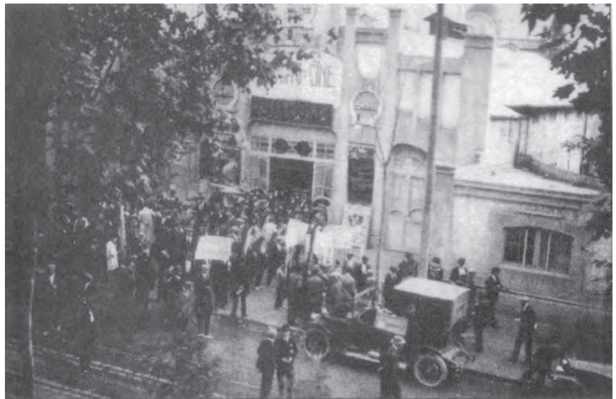
■ Manifestació contra l'agregació davant del cinema Spring el 9 de novembre de 1921 (1921).

esdevingut a dia d'avui negocis de roba o serveis, que sigui més difícil avituallar-se sense sortir de Sarrià que abans, posaria de manifest el procés inexorable d'haver deixat de ser poble . Com amb la resta d'institucions socials, els veïns recorden els trets distintius dels qui regentaven els «colmadors» fent servir, per referir-s'hi, en molts casos, malnoms (senyal de rellevància social, sigui en positiu o negatiu), i integrant-los en el quadre dels estatus i les reputacions. En qualsevol cas, s'establien amb molts botiguers relacions que defugien el tracte exclusivament comercial i implicaven també l'esfera personal.