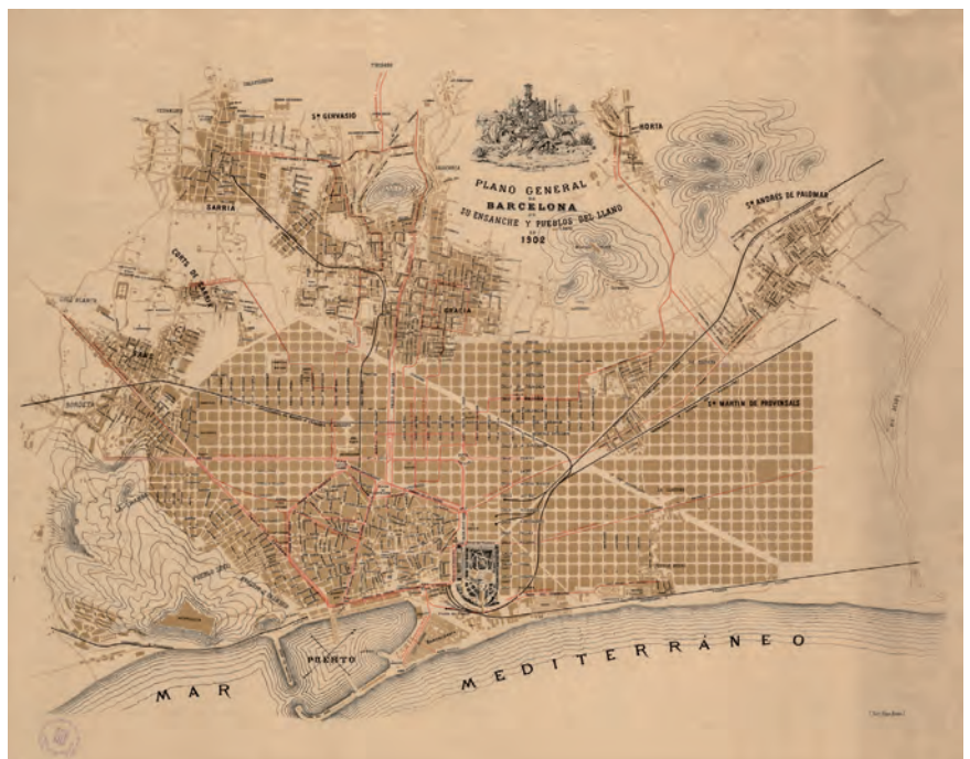
■ En aquest plànol del 1902 s'observa clarament aquesta confusió entre el que és la Barcelona projectada i la real, tot presentant com a realitat quelcom que és imaginat i desitjat. Per exemple, no s'hi distingeix el que ja està edificat de l'Eixample del que no ho està, i tampoc els municipis del Pla que ja no són independents dels que encara ho són.

tant de la nostra recerca (desenvolupada, entre d'altres, a l'Arxiu Municipal del districte de Sarrià-Sant Gervasi, a l'Arxiu de l'Associació de Veïns de Sarrià o al del Centre Excursionista Els Blaus). La nostra mirada a les fonts documentals ha tingut, igualment, un caràcter etnogràfic, i ha intentat anar més enllà de la descripció i correlació