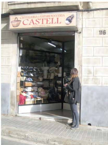
■ Cistelleria Castell al carrer Major de Sarrià, que, amb més de cent cinquanta anys d'història, ocupa, juntament amb la Cistelleria Vila, un paper destacat en l'imaginari col·lectiu de la comunitat en remetre directament a un passat menestral que es resisteix a desaparèixer (2012). MIGUEL DOÑATE SASTRE.

Precisament a Sarrià, a conseqüència del pes de la menestralia, observem com el negoci (la botiga, el taller...) apareix —juntament amb la casa— com a element referencial individual i familiar, i, fins i tot, comunitari. És, sens dubte, una de les principals institucions protagonistes de la quotidianitat sarriana, fins a dia d'avui. Sobretot determinats negocis: els forns i les pastisseries, les ferreteries, les merceries, algunes llibreries, l'estanc, les peixateries, les pensions i els hostals, la lleteria, la castanyera, algunes fàbriques —de fideus, caramels, joguines, gasosa o pells—, la bòbila... I hi destaquen els cellers i els bars, el mercat —amb les seves pageses— i les botigues de queviures («colmadors»). D'aquestes, se'n recorda la ubicació exacta, i la seva història (en concret, l'any de tancament d'algunes) serveix per datar èpoques i pensar en les transformacions urbanístiques i socials. En aquest sentit, el fet que moltes hagin