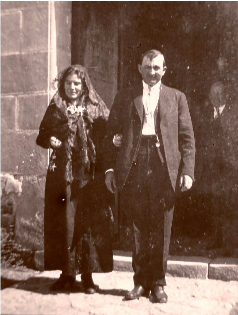
Fotografia d'uns nuvis sortint de l'església, a Samalús, Vallès Oriental. Número 0936 de l'arxiu actual al CSIC, referència 1347/0207. 28/09/1919. JOSEP M. BATISTA I ROCA N'ÉS L'AUTOR. CEDIDA PEL CSIC A L'ARXIU DE LA INSTITUCIÓ MILÀ I FONTANALS.

bibliografia més actualitzada, en totes les matèries properes (antropologia, geografia, folklore, mitologia i més), tal com es pot veure en el fons de la seva biblioteca, cedida a l'Arxiu Històric de la Ciutat de Barcelona.