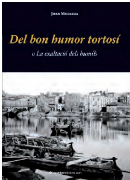
Coberta del llibre Del bon humor tortosí o La exaltació dels humils (2012).