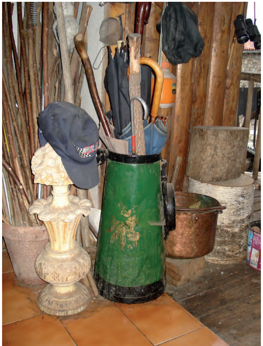
■ Una antiga lletera decorada i reconvertida en un paraigua a una casa de Músser (Cerdanya). Any 2009. CARLES GASCÓN

Gràcies a aquests exemples, podem dir amb Kirschenblatt-Gimblett que el patrimoni i el turisme són indústries col·laboradores, que actuen conjuntament i que impliquen la transformació de llocs en destinacions turístiques per fer-los viables com a exhibicions d'ells mateixos (1998: 151). La producció de valors i referències de qualitat en relació amb el passat es constitueix com una de les estratègies utilitzades per valorar el territori cap a l'exterior i, al mateix temps, garanteix la consolidació d'un nou model econòmic. ■