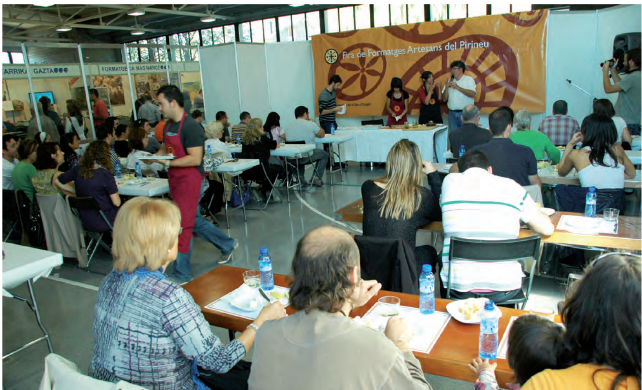
■ Aspecte de l'exposició permanent dedicada a la llet i el formatge de l'Espai Ermengol, a la Seu d'Urgell. Any 2011. ESPAI ERMENGOL

nomies d'escala va venir acompanyada per una reconfiguració de les realitats socials, culturals i geogràfiques, sobre les quals va projectar noves polítiques d'explotació. Es tracta de processos que permeten reconceptualitzar els recursos disponibles i els sistemes d'aprofitament. Si fins aquest moment s'havien entès els recursos naturals com a terres de conreu i de pastures, recursos dels boscos i fins i tot la producció d'energia gràcies a la construcció de grans centrals hidroelèctriques, llavors els processos de patrimonialització transformen aquestes consideracions. Les necessitats derivades de l'increment de població de les ciutats en el context de les realitats postindustrials projecten noves configuracions sobre els territoris propers. El Pirineu es pensa com una zona d'esbarjo que ofereix una sèrie de qualitats relacionades amb un passat idealitzat. Els criteris de ruralitat i d'autenticitat (Frigolé, 2007a), en relació amb els valors de la cultura i les tradicions locals, junt amb les noves conceptualitzacions de la natura com a