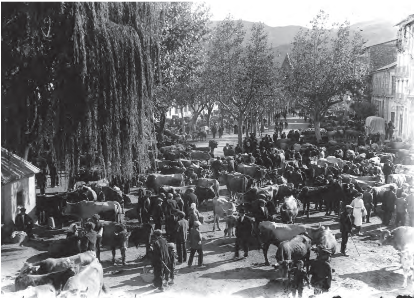
■ Fira de bestiar a la Seu d'Urgell. Començament de la dècada de 1930.

meitat del segle xx, quedaven força al marge d'aquest fenomen.