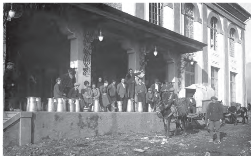
■ Moll de descàrrega de la fàbrica de la Cooperativa del Cadí, a la Seu d'Urgell.

les empreses làcties d'obtenir millors nivells qualitatius, l'obertura de camins per arribar als petits nuclis productors i l'augment del parc motoritzat en uns territoris que, almenys a la primera