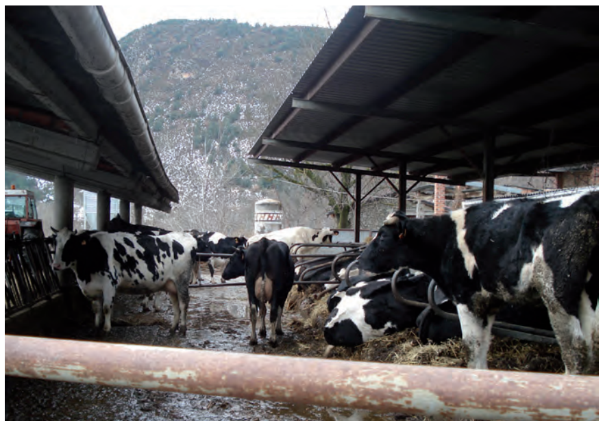
■ Explotació ramadera als afores de Martinet (la Cerdanya). Any 2009.

Seu d'Urgell. La producció de llet va seguir un camí de continua expansió, d'increment any rere any. Si l'any 1978